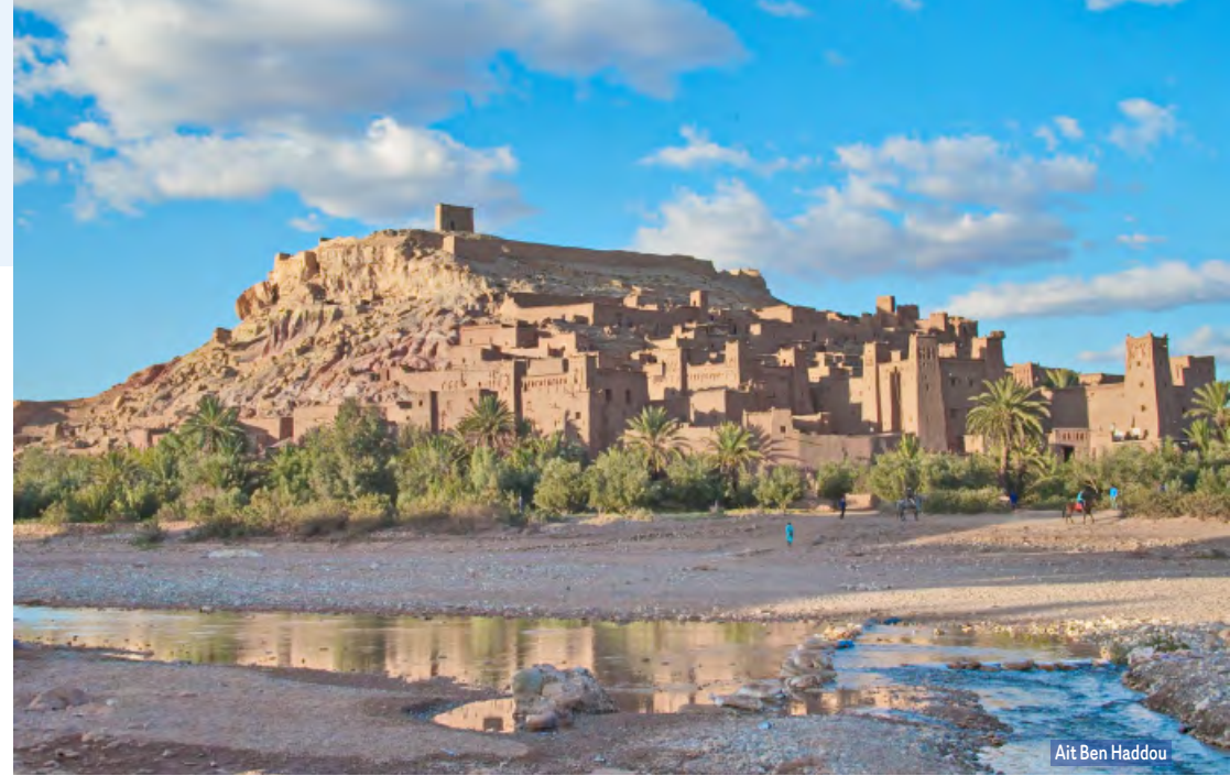
Ait Ben Haddou

Desayuno. Salida en dirección a Chaouen o Chefchaouen, uno de los pueblos más lindos de Marruecos. Pasearemos