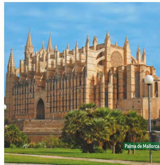
Palma de Mallorca

Precios a partir de Abril según nuestra Programación 2026/27.