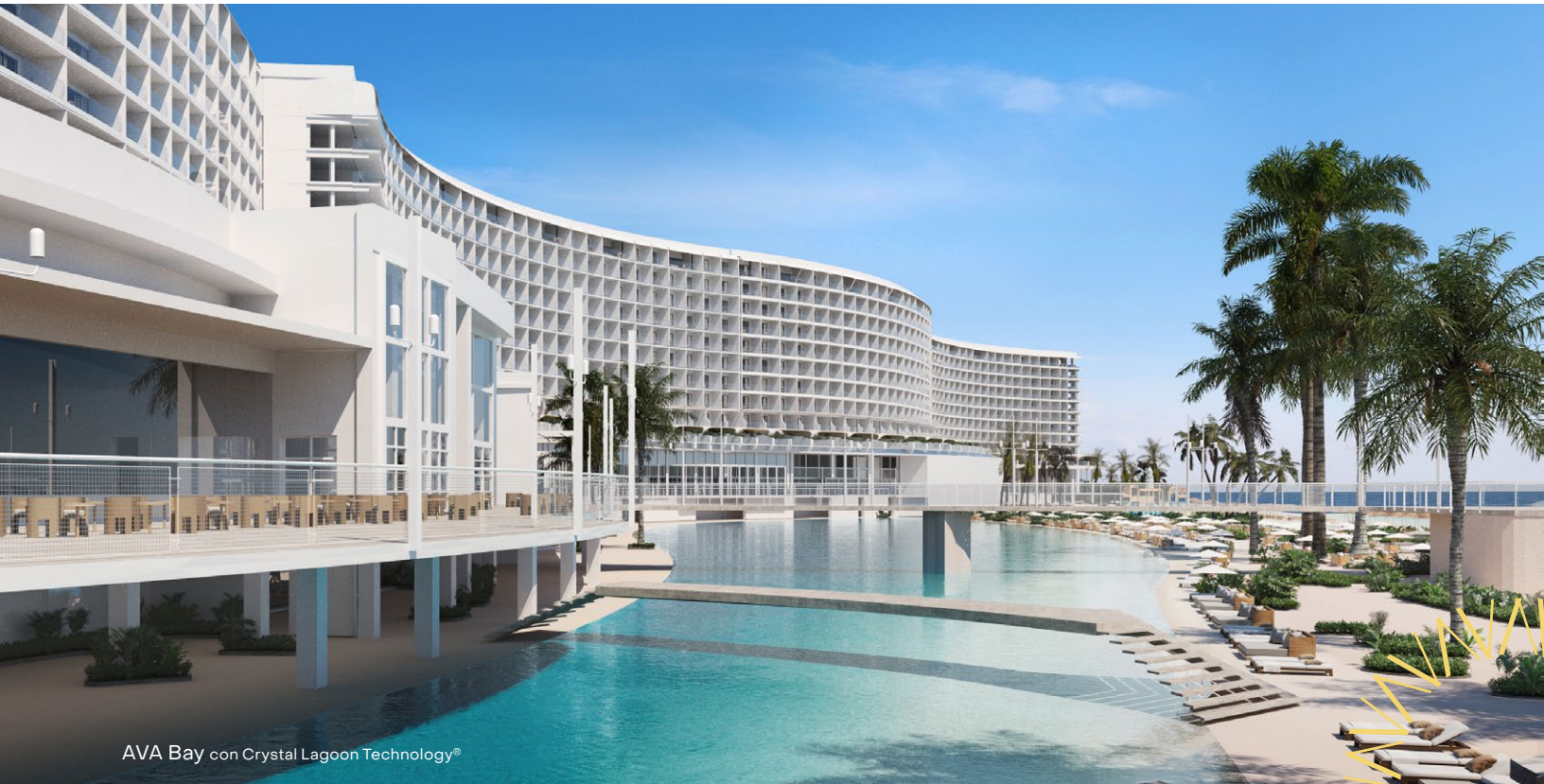
AVA Bay con Crystal Lagoon Technology®