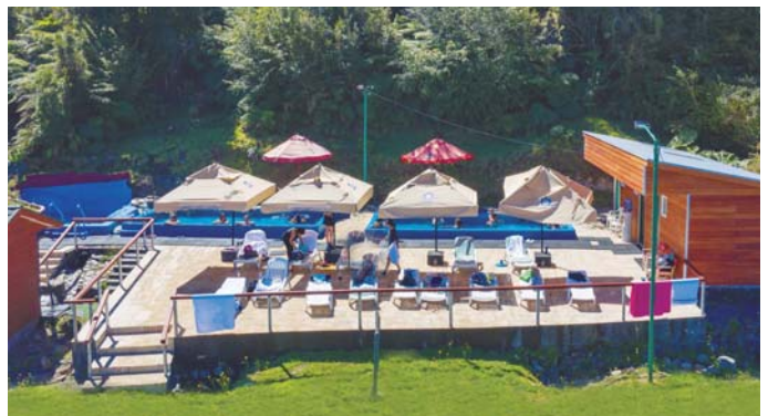
Fiordo de Quitalco