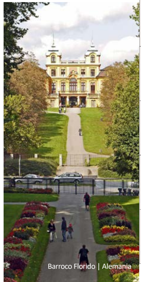
Barroco Florido | Alemania