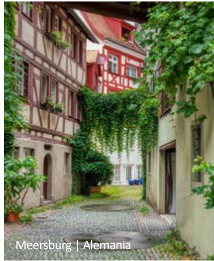
Meersburg | Alemania

Stuttgart no es sólo la sede de Mercedes-Benz y Porsche, es también una de las ciudades más verdes de Europa, con un hermoso centro histórico. Se pueden observar obras maestras de la arquitectura como el Viejo Castillo medieval, el Nuevo Palacio barroco, el hermoso mercado Markthalle y la colonia Weißenhof. El viaje termina en el aeropuerto de Stuttgart.