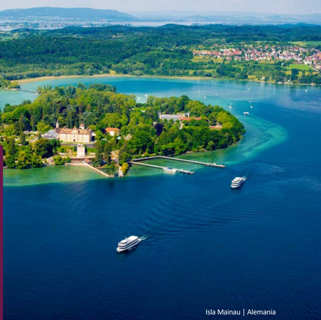
Isla Mainau | Alemania

Obligatorio presentar licencia de conducir nacional e internacional de forma física (no digital). La tarjeta de crédito debe estar a nombre del conductor. No se aceptan tarjetas virtuales ni tarjetas de débito.