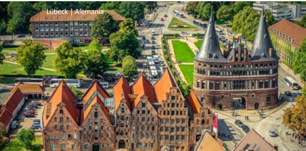
Lübeck | Alemania