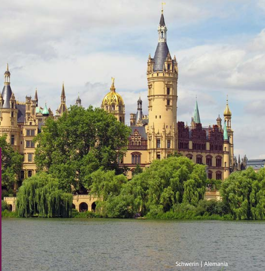
Schwerin | Alemania

Obligatorio presentar licencia de conducir nacional e internacional de forma física (no digital). La tarjeta de crédito debe estar a nombre del conductor. No se aceptan tarjetas virtuales ni tarjetas de débito.