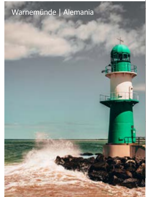
Warnemünde | Alemania