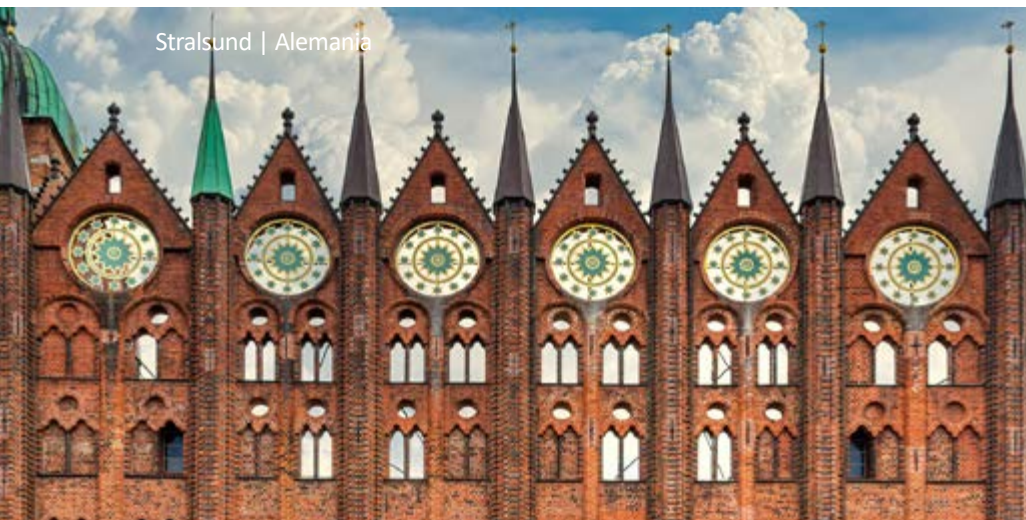
Stralsund | Alemania