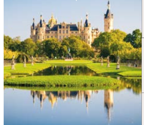
Castillo de Schwerin | Alemania