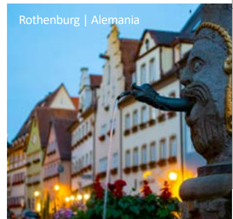
Rothenburg | Alemania