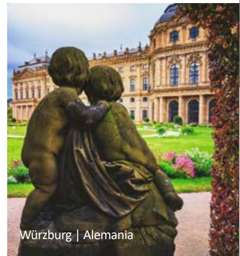
Würzburg | Alemania