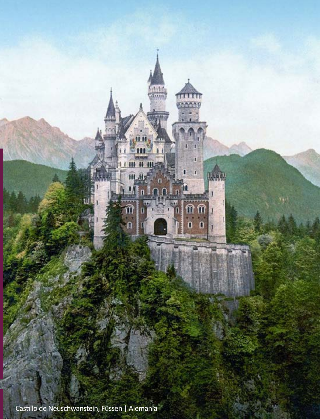
Castillo de Neuschwanstein, Füssen | Alemania

Obligatorio presentar licencia de conducir nacional e internacional de forma física (no digital). La tarjeta de crédito debe estar a nombre del conductor. No se aceptan tarjetas virtuales ni tarjetas de débito.