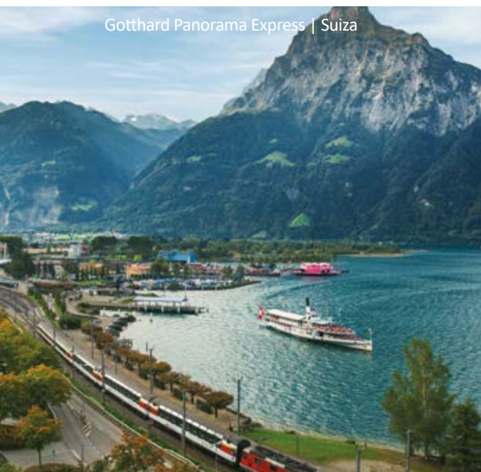
Gotthard Panorama Express | Suiza