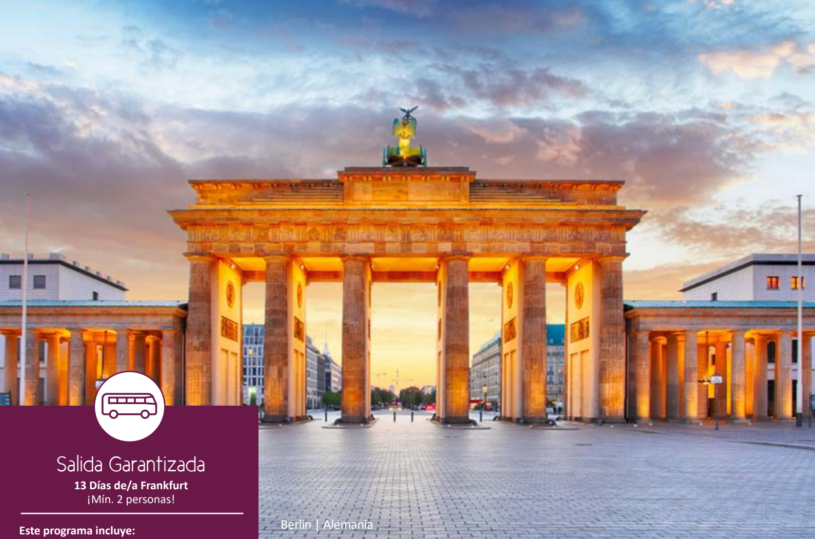
Berlín | Alemania