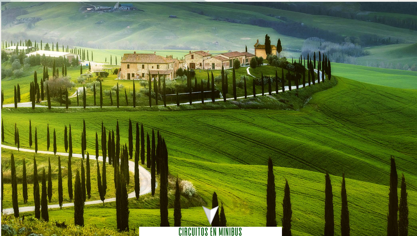
CIRCUITOS EN MINIBUS