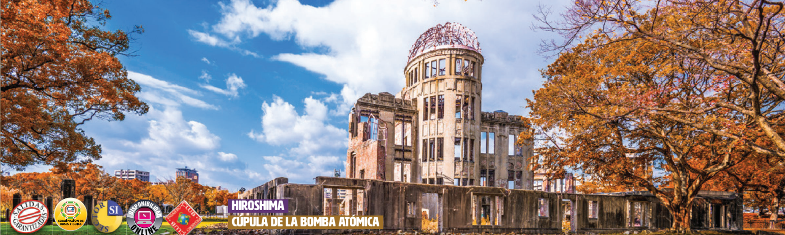
HIROSHIMA CÚPULA DE LA BOMBA ATÓMICA