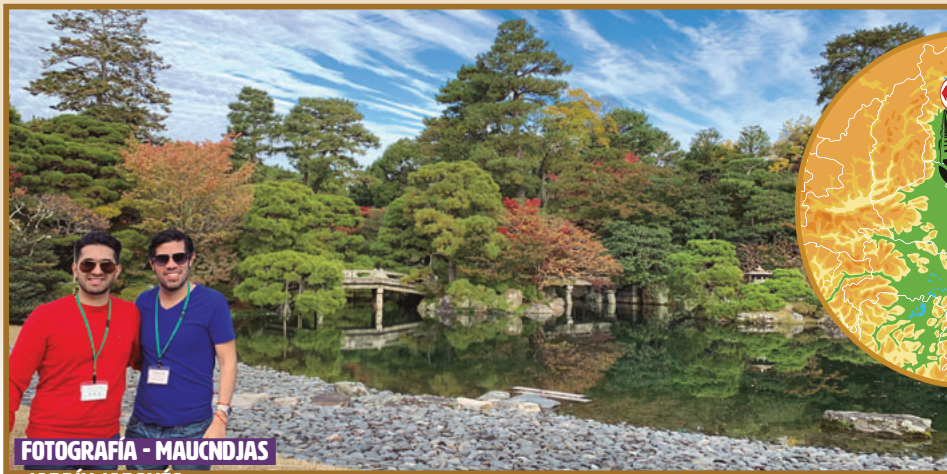
FOTOGRAFÍA - MAUCNDJAS JARDÍN JAPONÉS