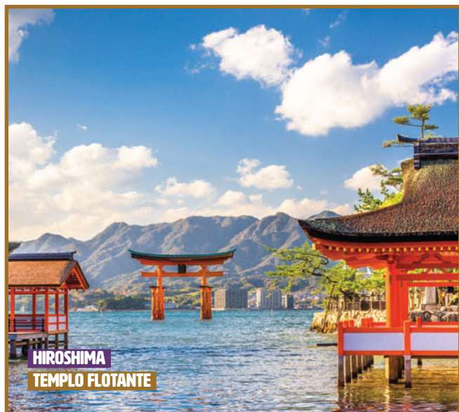
HIROSHIMA TEMPLO FLOTANTE