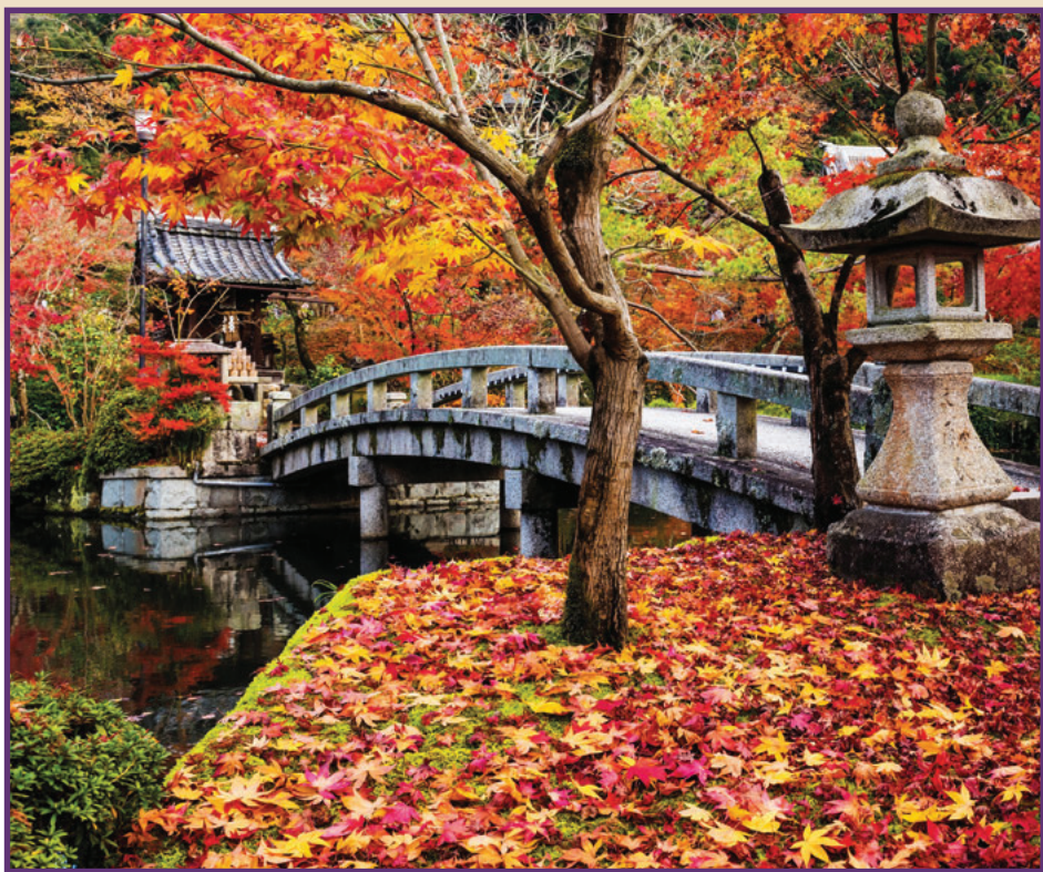
KIOTO PAISAJE OTONAL