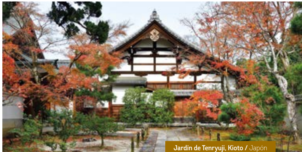
Jardín de Tenryuji, Kioto / Japón

Visita del paisaje volcánico de Owakudani. Seguimos a Oshino Hakkai, pequeña aldea con vistas al Monte Fuji. Seguimos a la idílica ciudad de Kawaguchiko. Paseo en barco. Entre espectaculares bosques, subimos al Monte Fuji. Regreso a Tokio y llegada al final del día. Fin de nuestros servicios.