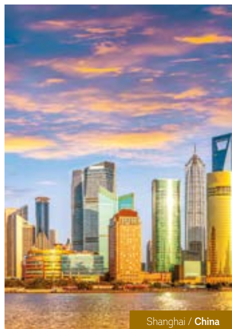
Shanghai / China

Entradas: Templo Engyo-ji en Engyo-ji, Castillo en Himeji, Jardines de Korakuen en Okayama, Templo Itsukushima, Museo Memorial de la Paz en Hiroshima. Ferry: Hiroshima - Miyajima. Funicular: Monte Shosa en Engyo-ji. 02 Almuerzos o cenas incluidos en: Himeji, Hiroshima.