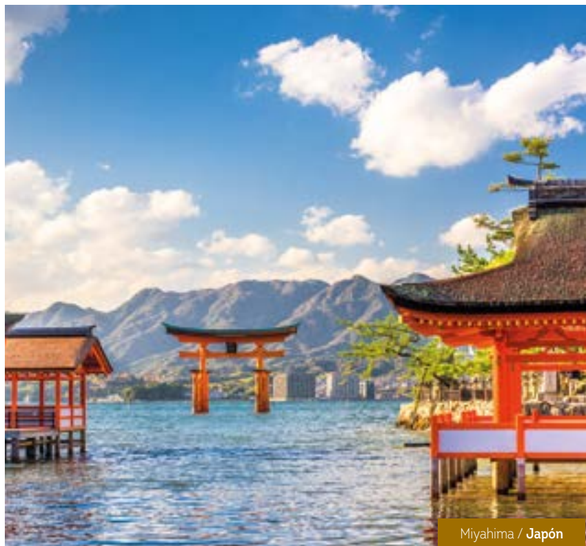
Miyajima / Japón

02 Almuerzos o Cenas Incluidos en: Himeji, Hiroshima.