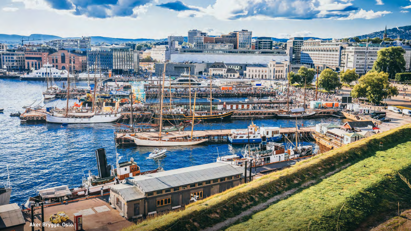
Aker Brygge. Oslo.

Vøringfossen para contemplar la poderosa cascada y las dramáticas vistas del cañón, antes de continuar el recorrido por el terreno montañoso hacia Oslo. Check-in en el hotel y alojamiento.