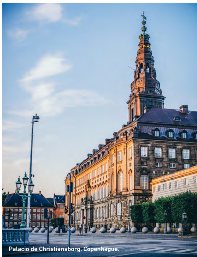
Palacio de Christiansborg. Copenhague.

Se señalarán nuestros lugares y joyas ocultas favoritas, ya sea para disfrutar de una cerveza por la tarde al sol, un café relajado por la mañana o simplemente un espacio tranquilo para desconectar del bullicio de la ciudad.