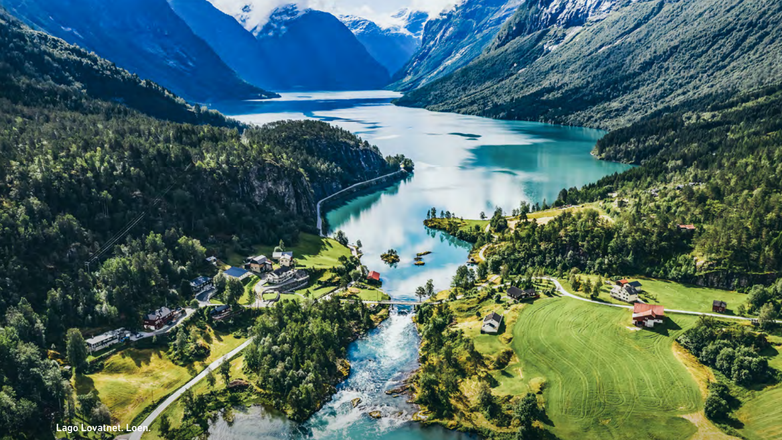
Lago Lovatnet. Loen.

das, cascadas y impresionantes miradores panorámicos, que te llevan al pintoresco pueblo de Geiranger, ubicado junto al mundialmente famoso fiordo Geiranger. Check-in en el hotel y cena.