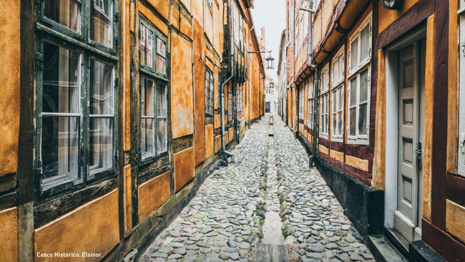
Casco Histórico. Elsinor.