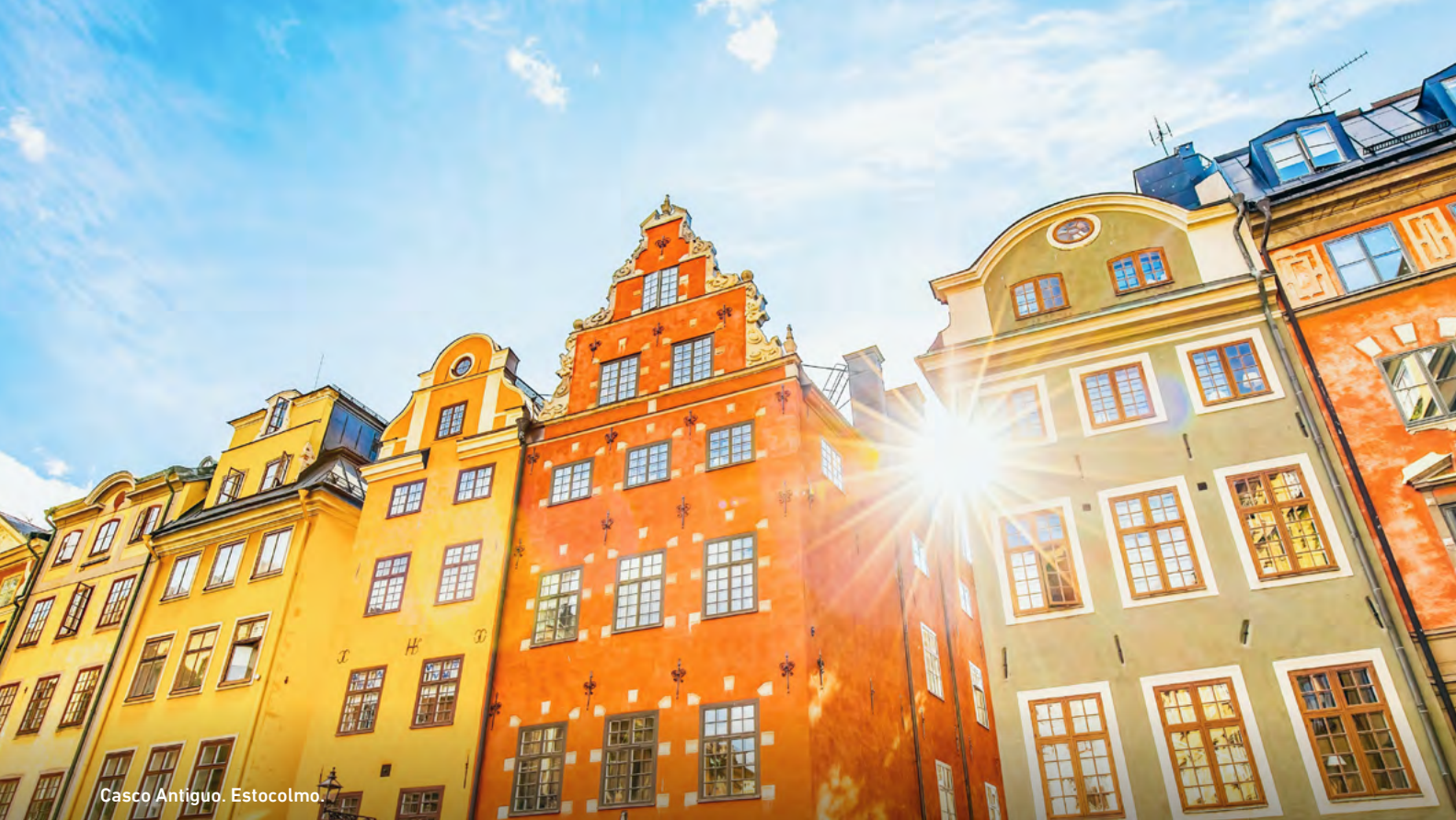
Casco Antiguo. Estocolmo.