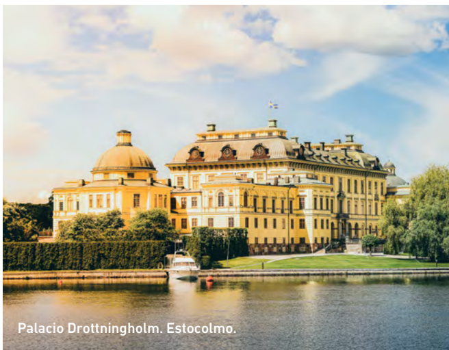
Palacio Drottningholm. Estocolmo.

Pasea por sus elegantes jardines, majestuosos interiores y su impresionante teatro, todo situado a orillas de un pintoresco lago. Es la combinación perfecta de historia, belleza y encanto real.