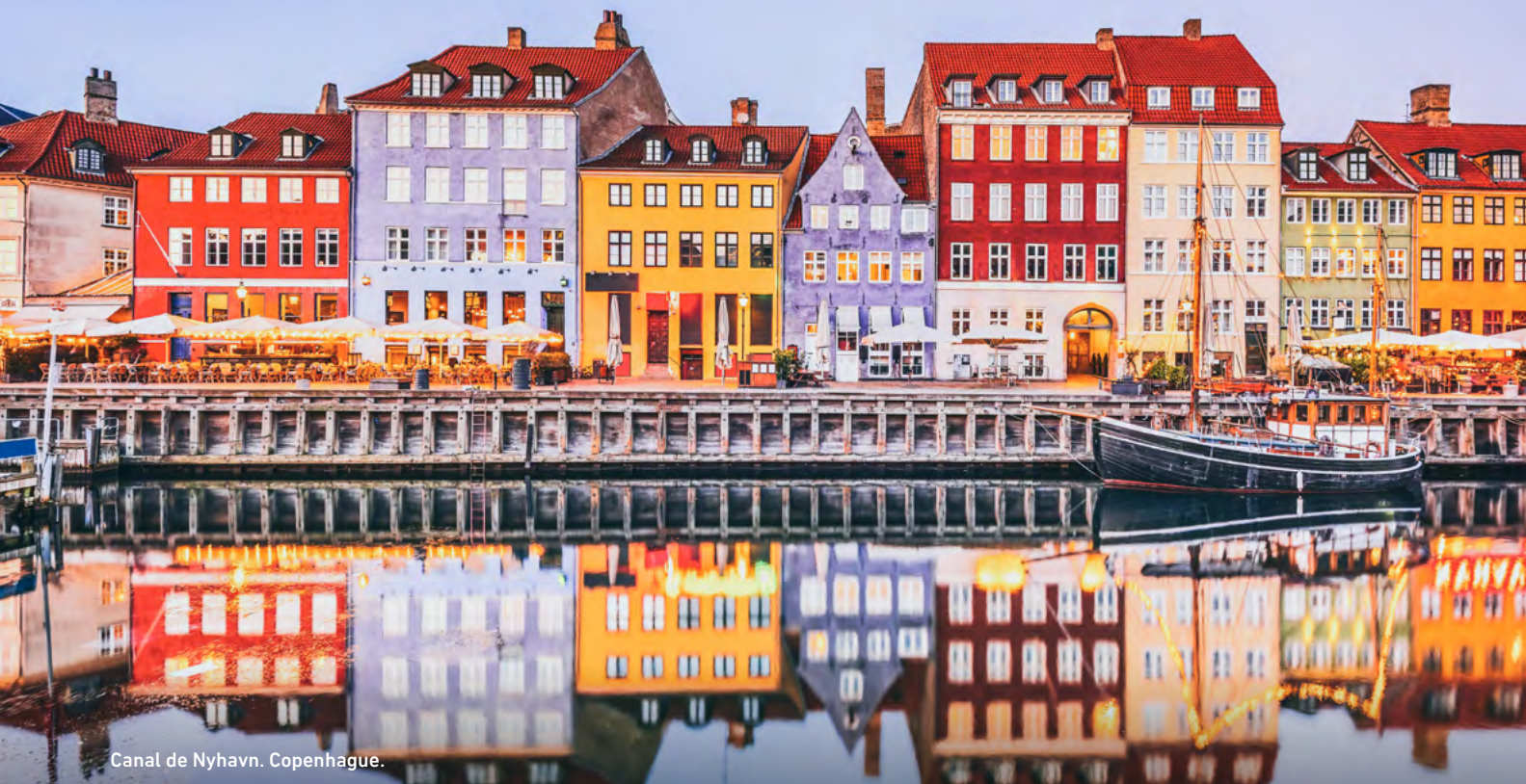
Canal de Nyhavn. Copenhague.

Poco después, haz una parada para fotos en la famosa estatua de la Sirenita, inspirada en el querido cuento de Hans Christian Andersen y uno de los símbolos más apreciados de Copenhague.