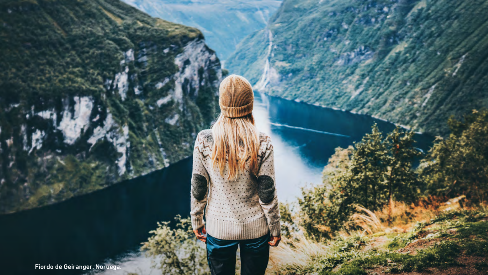
Fiordo de Geiranger. Noruega.

nica carretera Trollstigen, uno de los pasos montañosos más espectaculares de Noruega, con sus curvas cerradas, cascadas y impresionantes miradores panorámicos, que te llevan al pintoresco pueblo de Geiranger, ubicado junto al mundialmente famoso fiordo Geiranger. Check-in en el hotel, tarde libre y cena en el hotel.