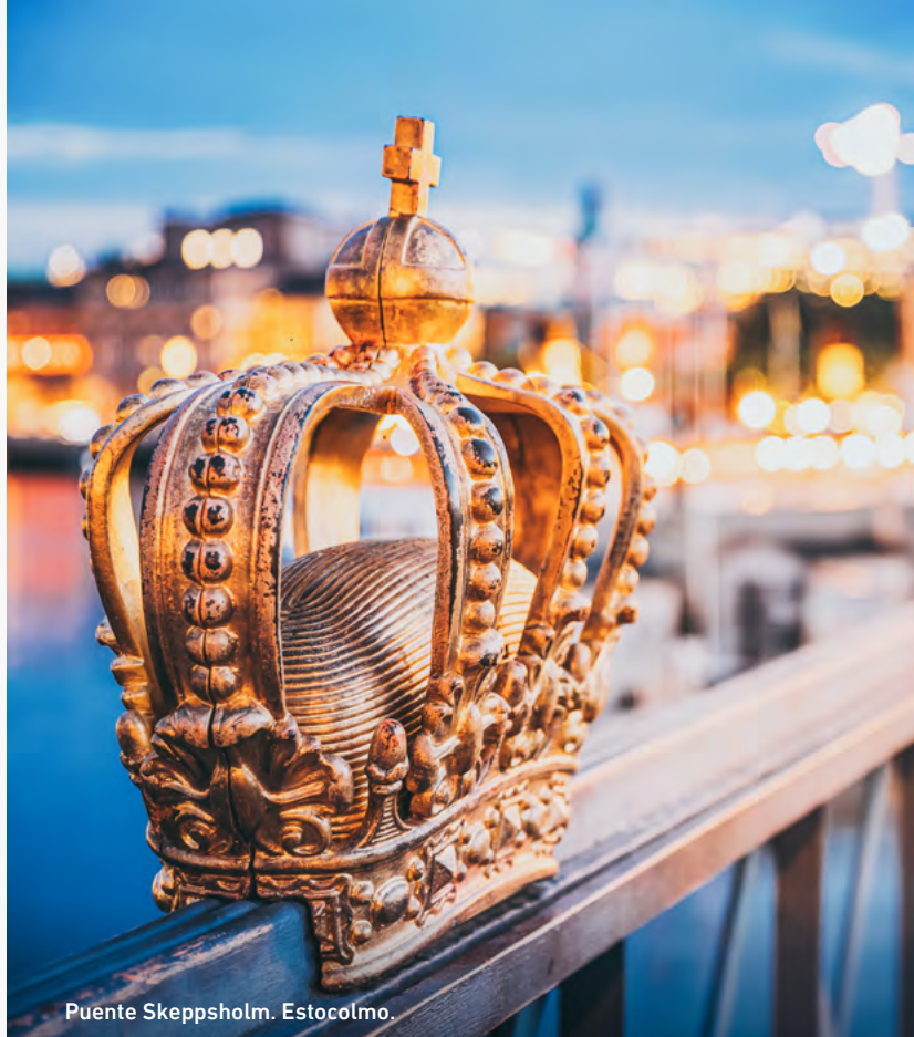
Puente Skeppsholm. Estocolmo.

Los traslados regulares de llegada y salida incluidos en el programa son válidos exclusivamente desde el Aeropuerto de Estocolmo y Aeropuerto de Oslo y solo en las fechas oficiales de inicio y fin del tour. Estos traslados son realizados por un representante de Borealis DMC que habla inglés y son compartidos con otros huéspedes. Como tal, puede haber un breve tiempo de espera en el aeropuerto a la llegada. Para los huéspedes que requieran un traslado privado, o para aquellos con pernoctaciones previas o posteriores al tour, se aplicará un suplemento por cualquier traslado organizado fuera de las fechas oficiales del programa o por servicios que requieran transporte individual.