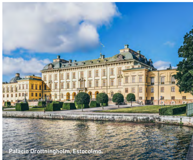
Palacio Drottningholm, Estocolmo.

Descubre el encanto del casco antiguo de Estocolmo en un recorrido guiado a pie de 2 horas por Gamla Stan. Pasea por sus calles empedradas, admira los coloridos edificios medievales y conoce la fascinante historia de la ciudad, sus leyendas y su patrimonio real. El recorrido incluye una pausa para un fika tradicional sueco, un momento para relajarte y disfrutar de café y repostería como un verdadero local.