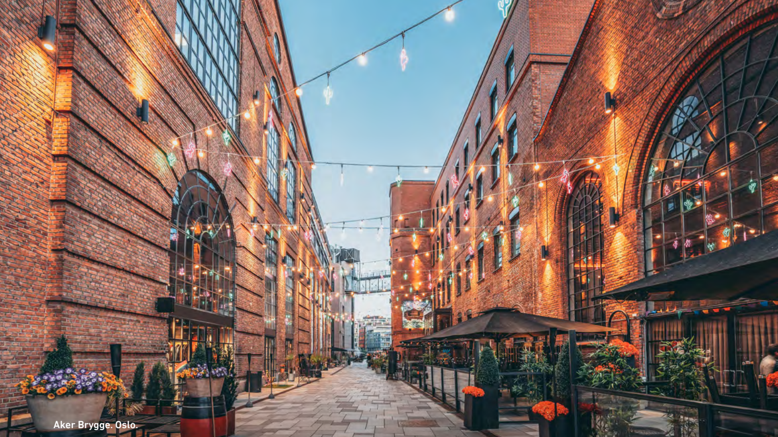
Aker Brygge. Oslo.

fruta de un paseo relajado por el parque, admirando las obras únicas y poderosas que reflejan la experiencia humana. Traslado al aeropuerto de Gardermoen.