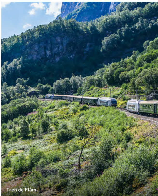
Tren de Flåm.

Durante un recorrido panorámico por la ciudad, disfrutarás de un agradable paseo por el típico barrio de Bryggen, con sus pintorescos edificios de frontones apuntados frente al puerto. Verás la Iglesia de Santa María, así como los mercados de pescado en el antiguo muelle hanseático, donde se venden todas las especialidades de mariscos del norte de Escandinavia, como salmón y cangrejos reales.