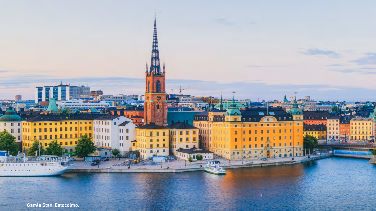
Gamla Stan. Estocolmo.

al puerto para reunirse con el resto del grupo, que llega desde Helsinki con la Tallink Silja Line. A partir de ahí, inicio de un recorrido turístico de 3 horas.