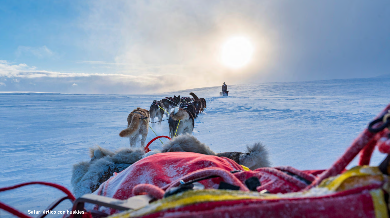
Safari ártico con huskies

famoso Pueblo de Papá Noel, ubicado justo sobre el Círculo Polar Ártico. ¡Un momento inolvidable y mágico! Visita la casa de Papá Noel, donde él mismo te dará la bienvenida; No hay palabras para describir las emociones que se sienten en este momento de cuento de hadas! Pero te garantizamos que quedará grabado en tu memoria para siempre. Durante la visita también podrás enviar una carta a tus seres queridos que llegará en Navidad con un saludo de Santa Claus.