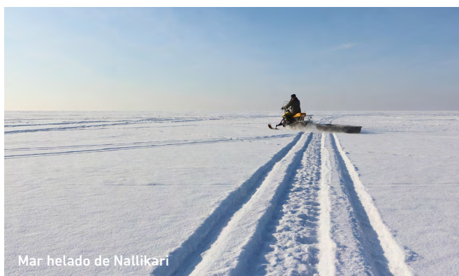
Mar helado de Nallikari

Encuentro con el guía y salida para una aventura en el mar helado de Nallikari, donde se realizará una caminata por el mar Báltico congelado, con una actividad de pesca en hielo utilizando equipo tradicional. Al finalizar, continuación hacia Rovaniemi – ¡La ciudad oficial de Papá Noel! Tu mágico viaje en el Círculo Polar Ártico, Laponia, Finlandia comienza aquí. La tarde es libre.