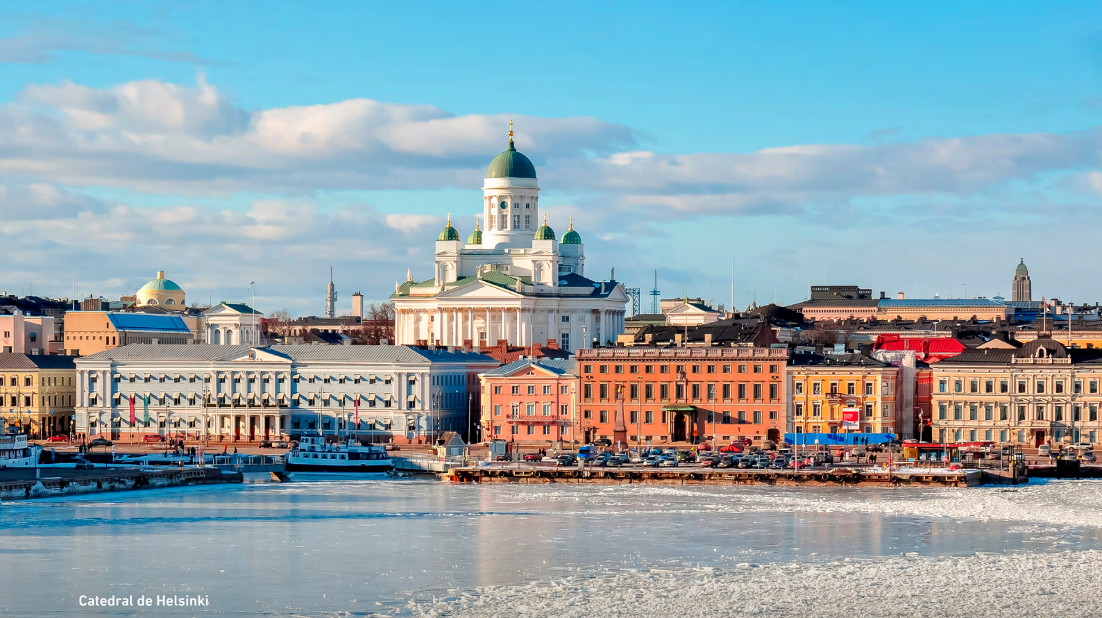
Catedral de Helsinki

arquitectura moderna convive con los monumentos históricos. Explora la animada Plaza del Mercado, la majestuosa Catedral de Helsinki, la Iglesia de la Roca (entrada incluida) y el moderno distrito del design. Regreso al hotel.