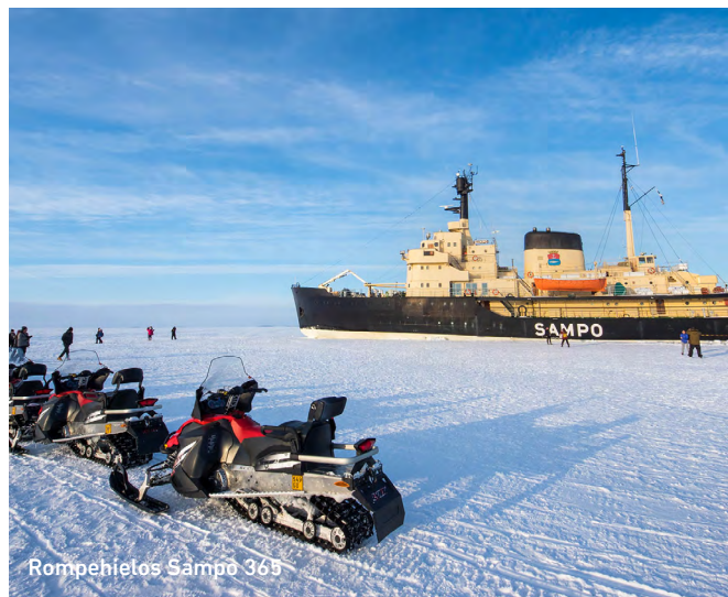
Rompehielos Sampo 365

Desayuno en el hotel y salida hacia Haparanda, ubicada en el extremo noreste de Suecia, justo en la frontera con Finlandia. Haparanda es un lugar donde las culturas se encuentran y la naturaleza te rodea. Conocida por su encanto transfronterizo único y su entorno tranquilo junto al río Torne. Llegada y alojamiento. Cena en el hotel.