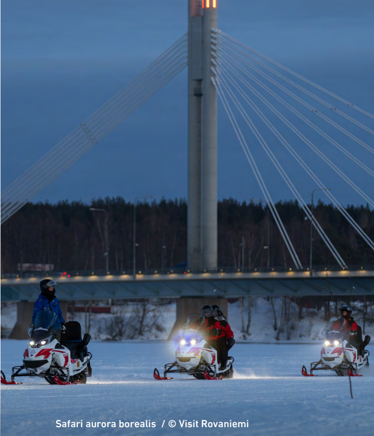
Safari aurora borealis

* Por razones de seguridad, la actividad de flotación en hielo requiere una altura mínima de 130 cm.