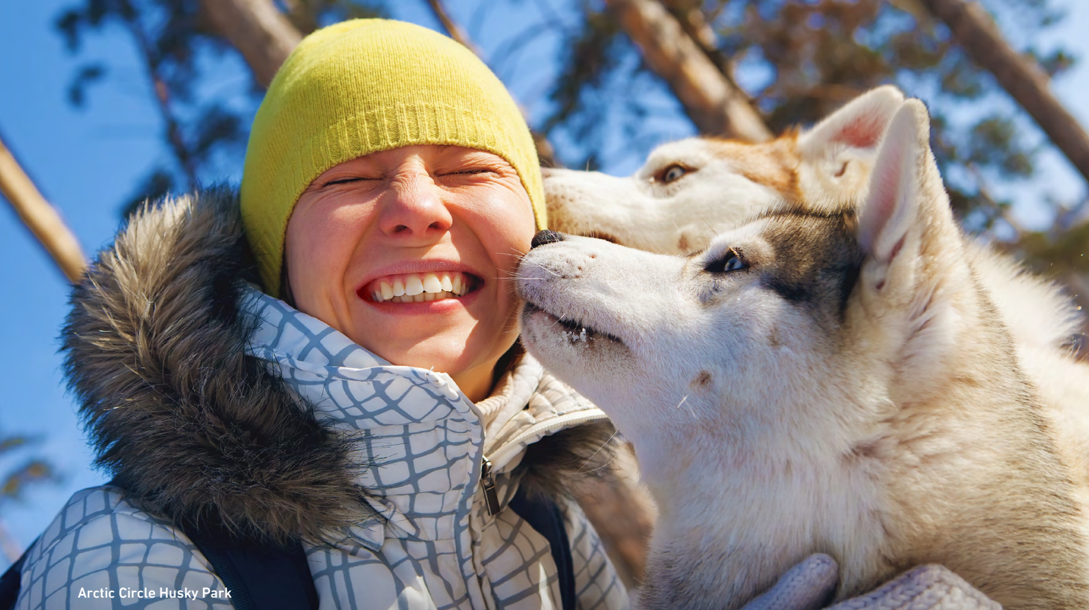
Arctic Circle Husky Park