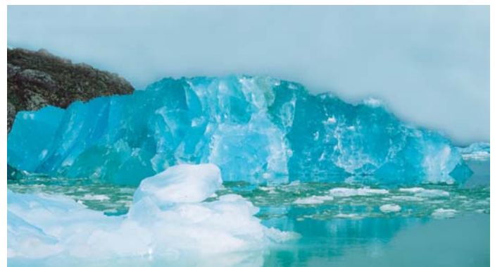
Glaciar Pío XI