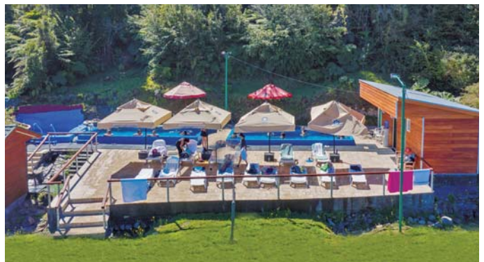
Fiordo de Quitalco