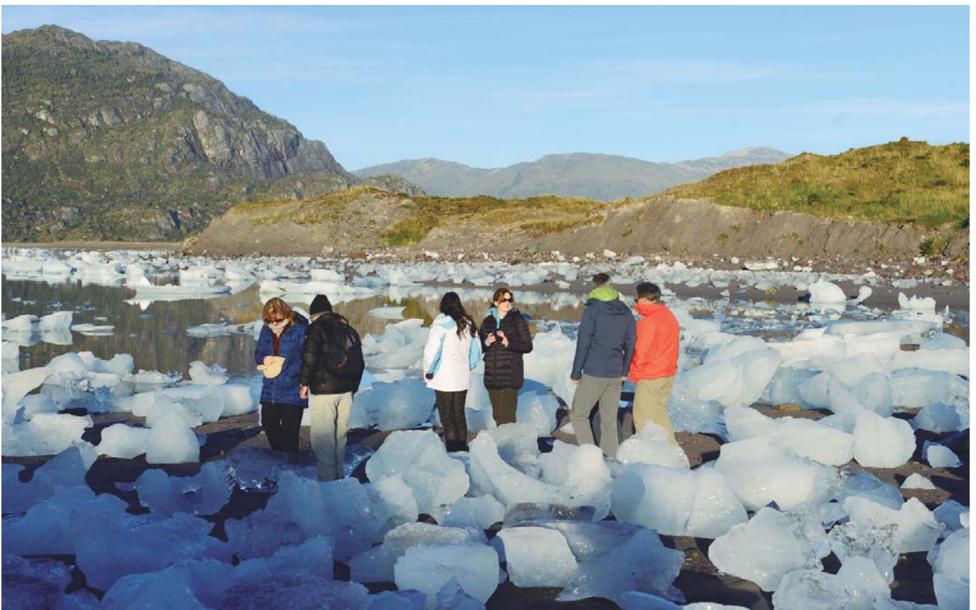
Glaciar Bernal y Glaciar Amalia