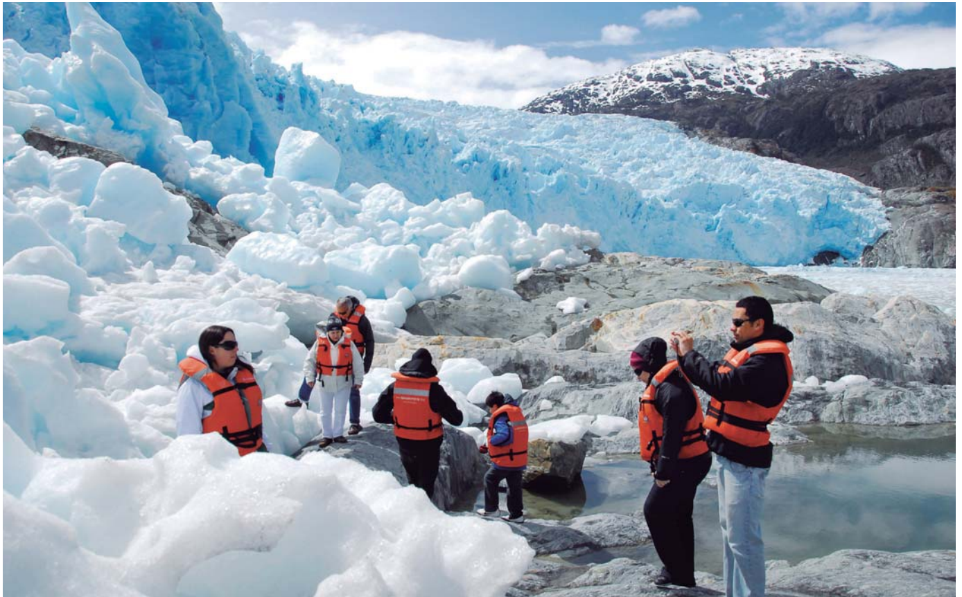
Glaciar El Brujo