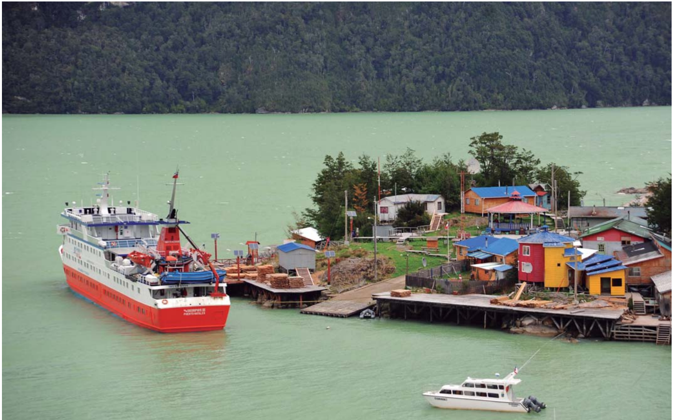
Puerto Edén y Caleta Tortel