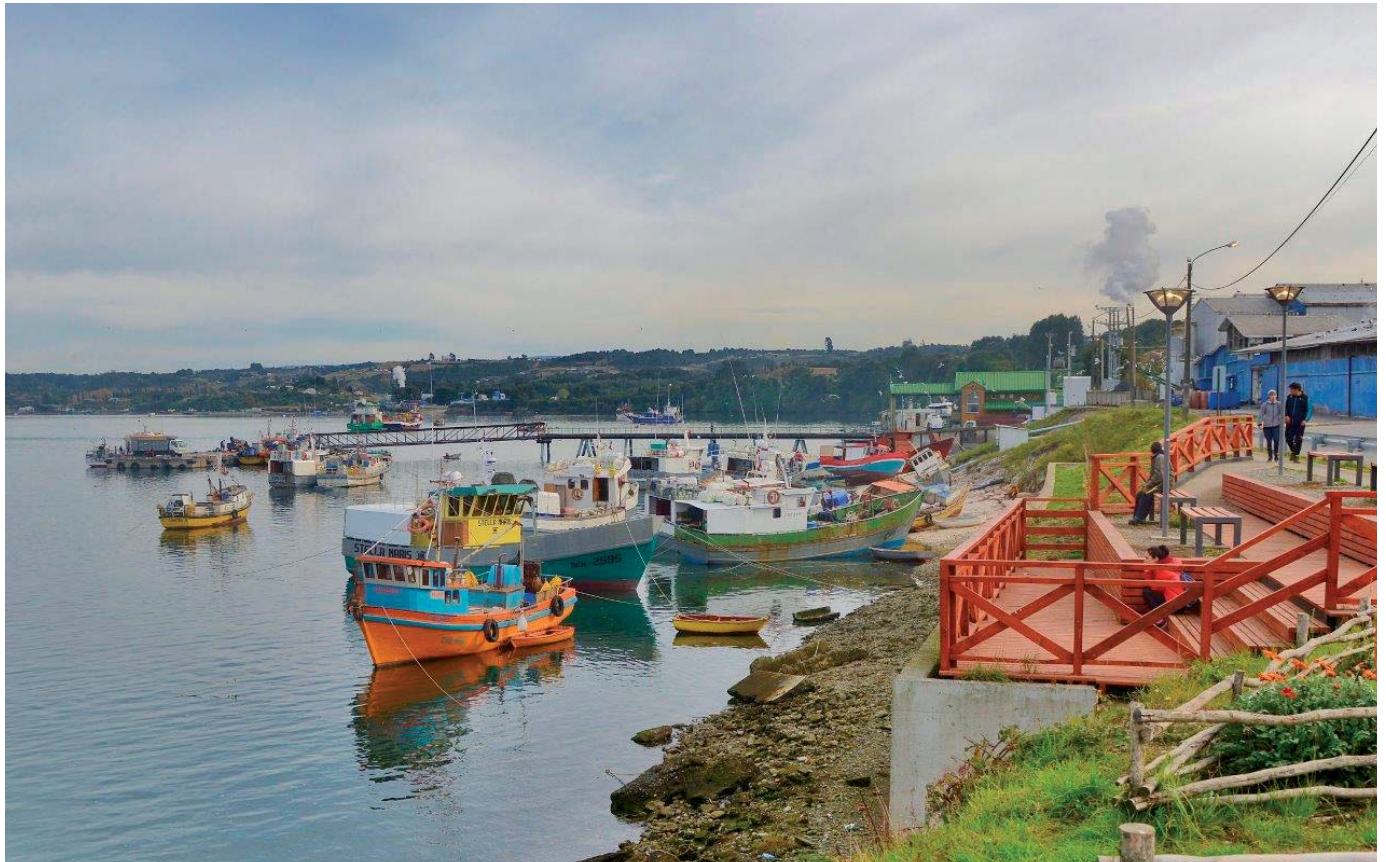
Vistas de las ciudades de Puerto Montt y Dalcahue