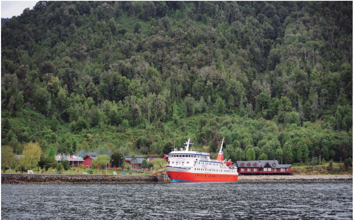
Fiordo de Quintralco