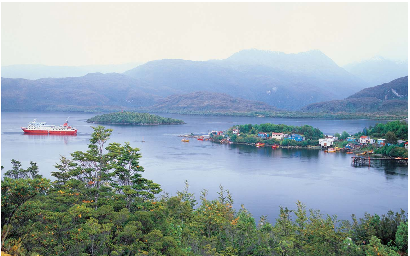
Glaciar Bernardo y Puerto Edén.