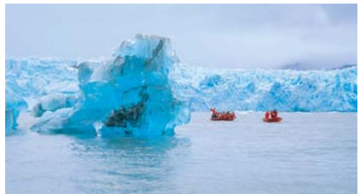
Glaciar Pío XI