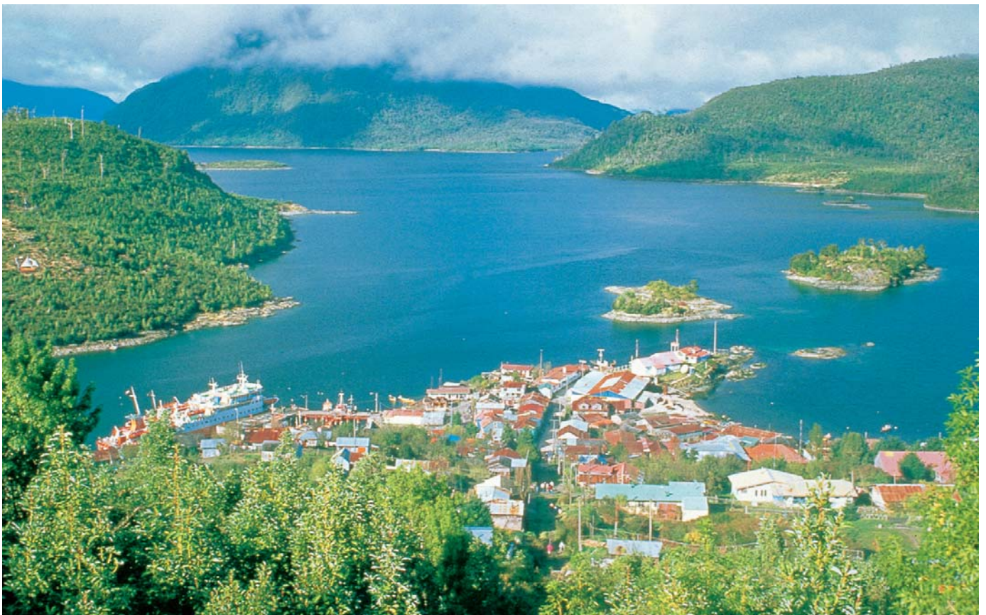
Vistas de las ciudades Puerto Montt, Calbuco y la aldea de Puerto Aguirre.