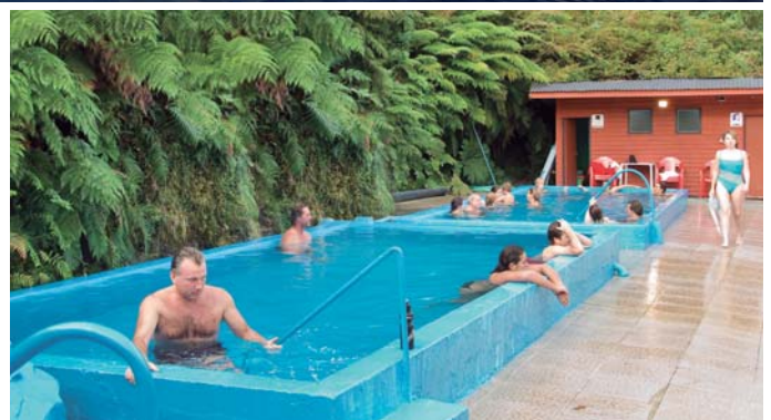
Fiordo de Quintralco