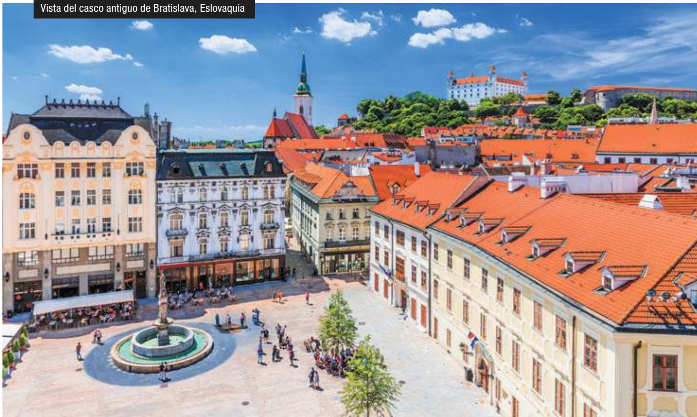
Vista del casco antiguo de Bratislava, Eslovaquia

• suplemento individual en Dbl estándar: +50% • Doble cat. F: NNº 100, 101, 108, 109 • Doble cat. G: NNº 220, 223, 242, 245 • Doble cat. H: NNº 301, 302, 323, 324 • suplemento individual en Deluxe: +75% • traslados colectivos: desde 90 eur/pax/trayecto • seguro de gastos de anulación: desde 55 eur