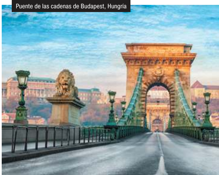
Puente de las cadenas de Budapest, Hungría

Programación y horarios sujetos a cambios