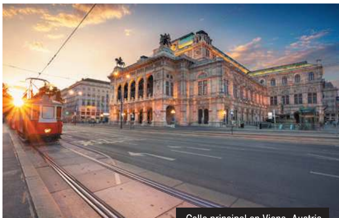
Calle principal en Viena, Austria