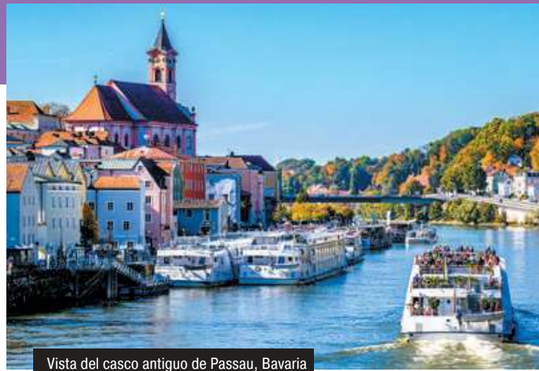
Vista del casco antiguo de Passau, Bavaria

Desembarque después del desayuno (muelle de Lindau). Fin de nuestros servicios.