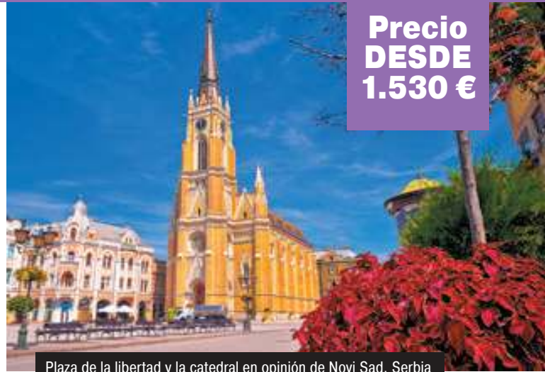
Plaza de la libertad y la catedral en opinión de Novi Sad, Serbia

Pensión completa a bordo. A primera hora de la mañana, llegaremos a Belgrado, capital de Serbia y una de las ciudades más antiguas de Europa. Alberga un sinfín de monumentos como la fortaleza Kalemegdan, el