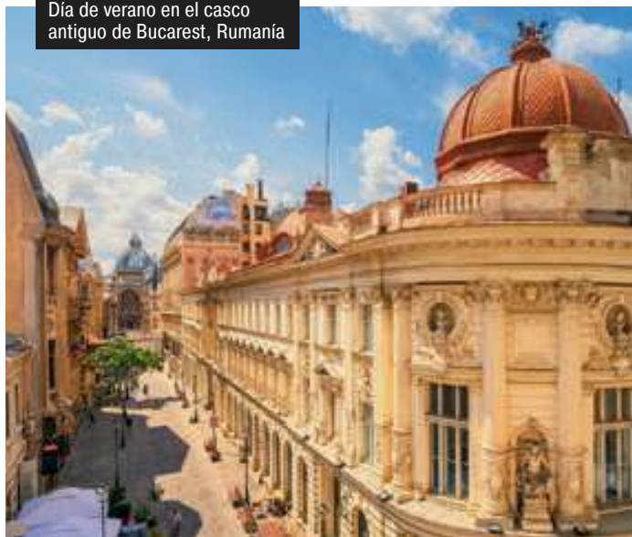
Día de verano en el casco antiguo de Bucarest, Rumanía

Desembarque después del desayuno. Fin de nuestros servicios.