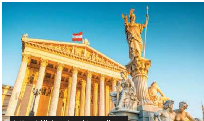
Edificio del Parlamento austriaco en Viena

PVP del paquete de 5 visitas es de 225 eur/pax. La visita panorámica de Bucarest se ofrece solo si los horarios de vuelos lo permiten.