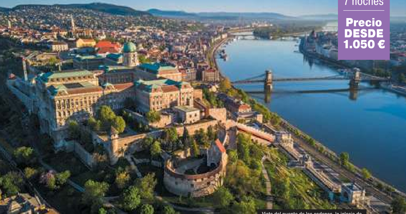
Vista del puente de las cadenas, la iglesia de Matías y el Parlamento de Budapest, Hungría