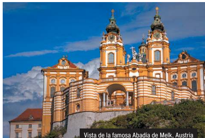
Vista de la famosa Abadía de Melk, Austria

Programación y horarios sujetos a cambios