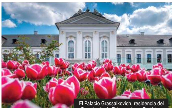
El Palacio Grassalkovich, residencia del Presidente de Eslovaquia en Bratislava