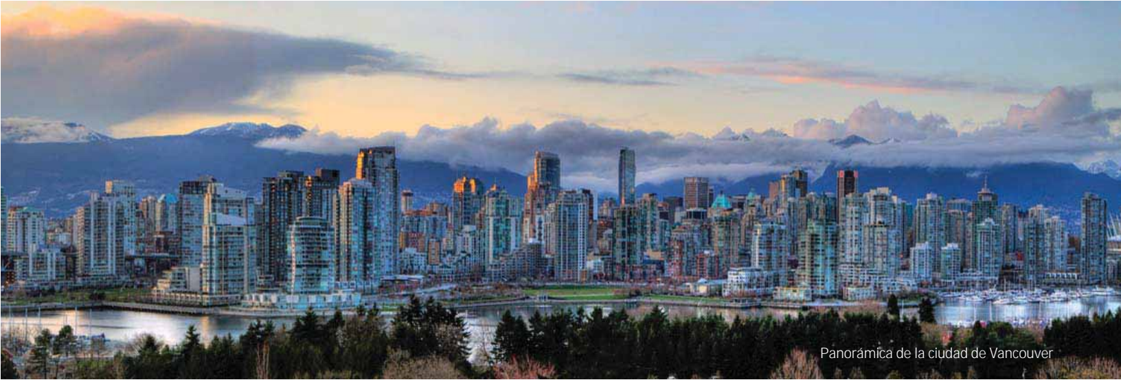
Panorámica de la ciudad de Vancouver