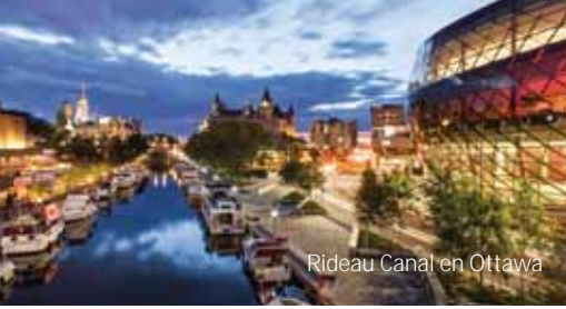
Rideau Canal en Ottawa