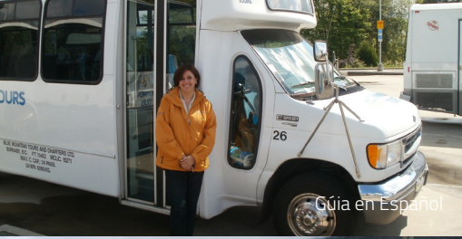
Guía en Español