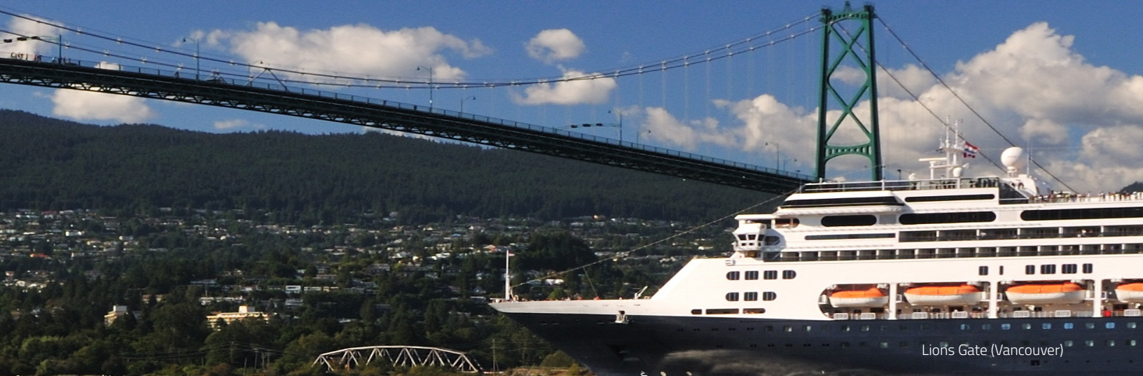
Lions Gate (Vancouver)