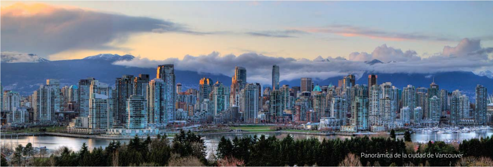
Panorámica de la ciudad de Vancouver