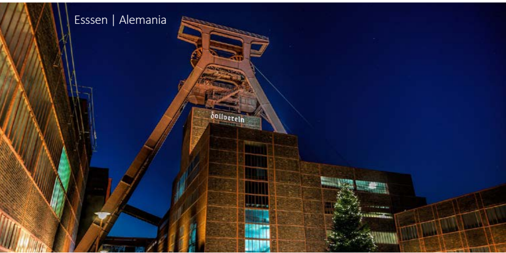
Essen | Alemania

Aquí el río Spree se divide en más de 300 arroyos distintos como un laberinto, por los cuales se realizará un paseo inolvidable en canoa para descubrir la reserva natural con sus pueblos y granjas. Al terminar, visita a Potsdam, para admirar el bello parque y el palacio de Sanssouci (UNESCO). Por la tarde llegada a Berlín.