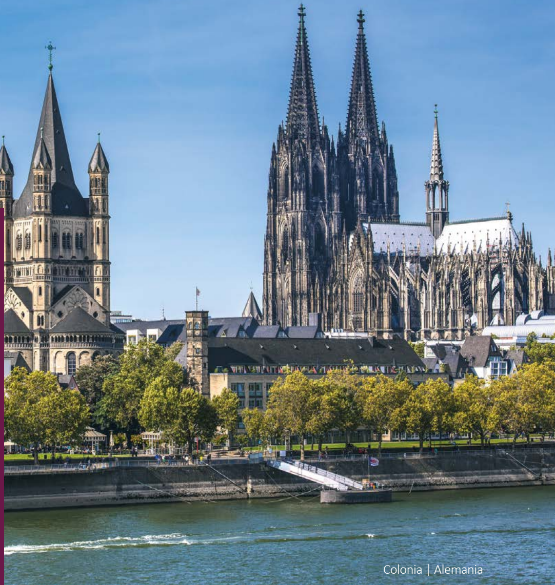
Colonia | Alemania

Obligatorio presentar licencia de conducir nacional e internacional de forma física (no digital). La tarjeta de crédito debe estar a nombre del conductor. No se aceptan tarjetas virtuales ni tarjetas de débito.