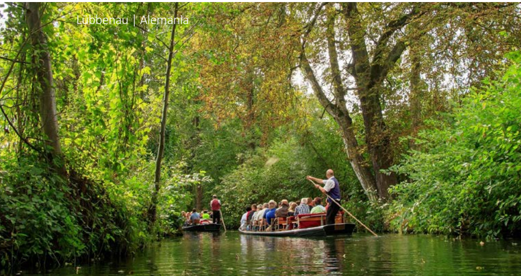
Lübbenau | Alemania