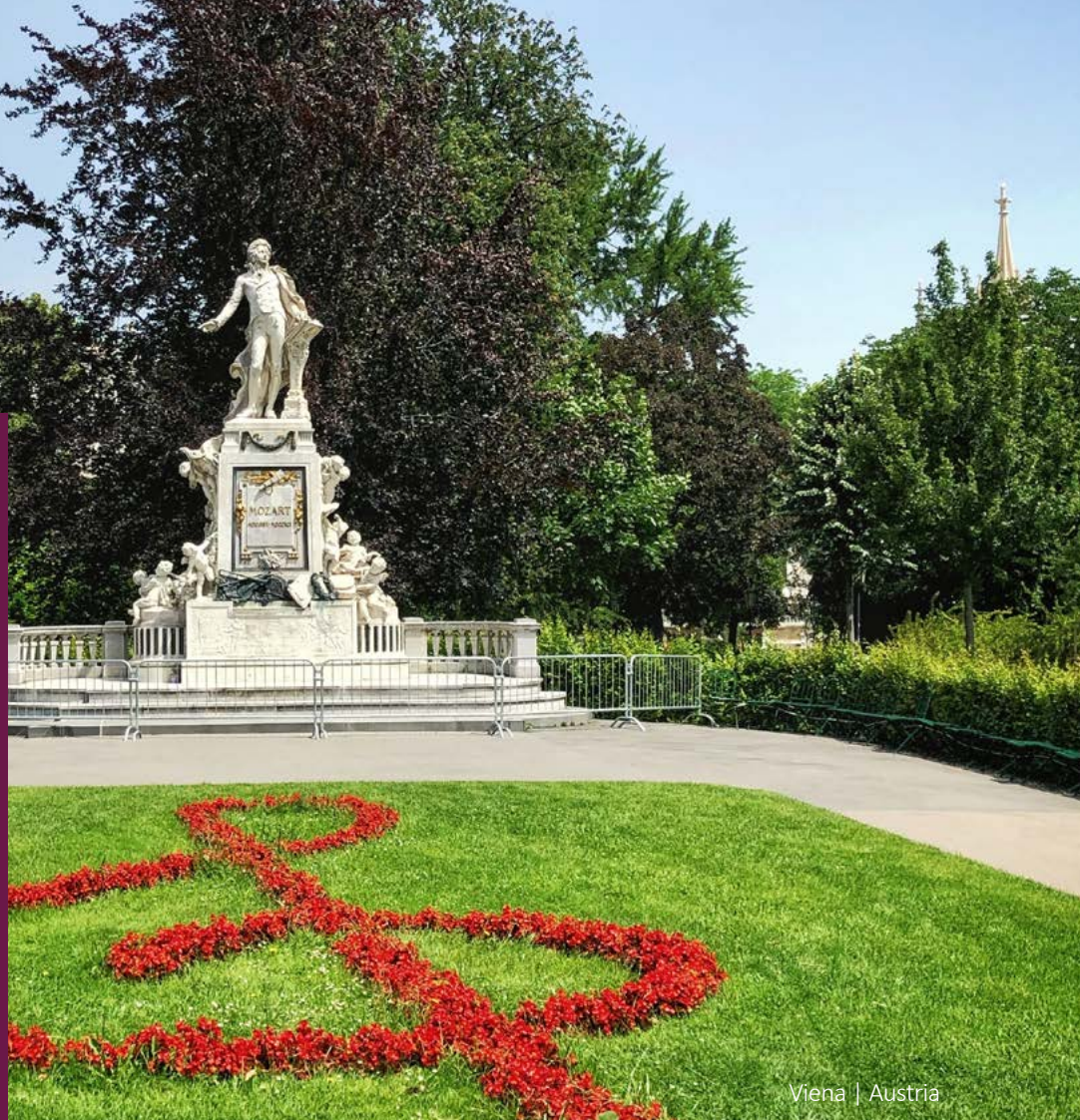
Viena | Austria

Obligatorio presentar licencia de conducir nacional e internacional de forma física (no digital). La tarjeta de crédito debe estar a nombre del conductor. No se aceptan tarjetas virtuales ni tarjetas de débito.