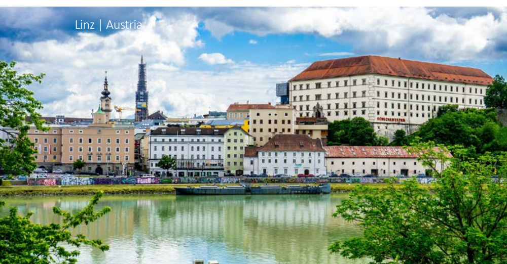
Linz | Austria

Por la mañana se acercará a la vida de Mozart en Praga. En el casco antiguo de la ciudad visitará la Torre de la Pólvora y la Plaza Vieja, dominada por el Ayuntamiento con su Reloj Astronómico, así como las impresionantes Iglesias de Týn y de San Nicolás. Recorrerá el Puente de Carlos, donde puede apreciar una galería de estatuas barrocas con una hermosa vista al Castillo de Praga. ¡Ahora se entiende por qué Mozart dedicó toda una sinfonía a esta ciudad! Regreso a Múnich.