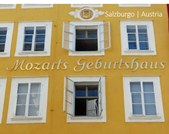
Salzburgo | Austria