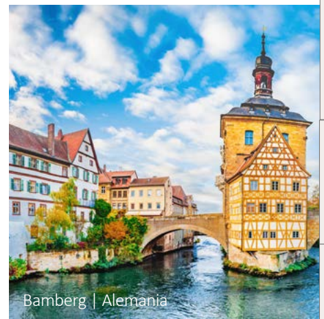
Bamberg | Alemania