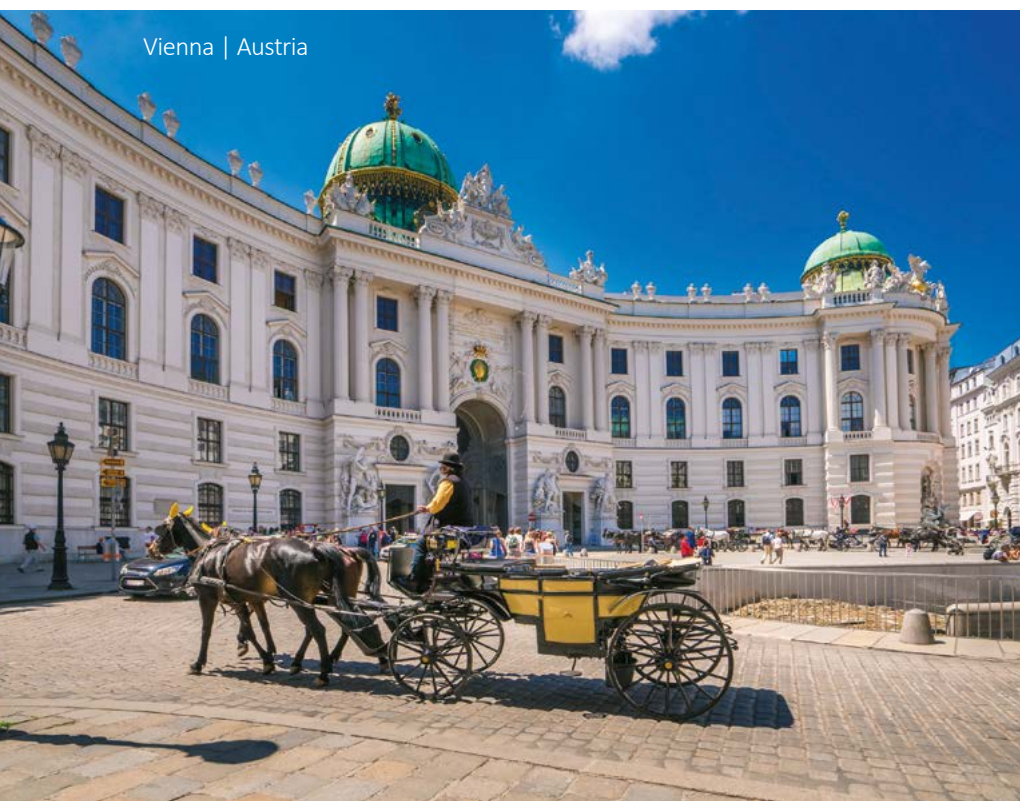
Vienna | Austria