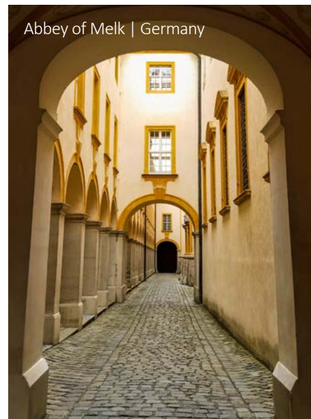
Abbey of Melk | Germany