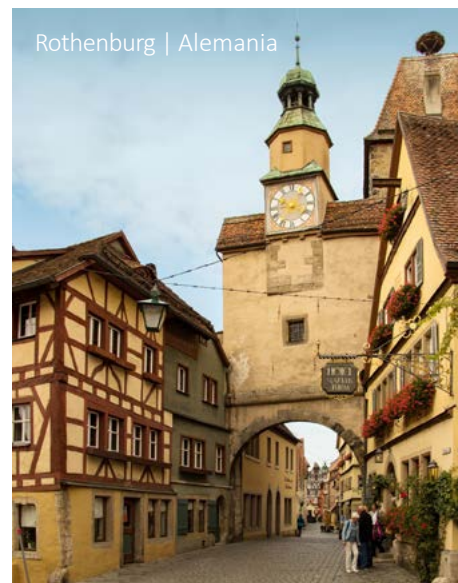
Rothenburg | Alemania