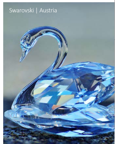
Swarovski | Austria