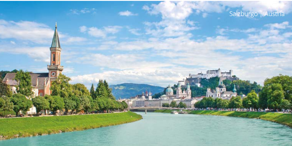
Salzburgo | Austria

9 Berchtesgaden - Lago Chiemsee - Múnich Por la mañana salida hacia Múnich. En el camino parada a orillas del Lago Chiemsee. Llegada a Múnich por la tarde y fin de los servicios.