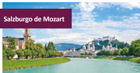
Salzburgo de Mozart