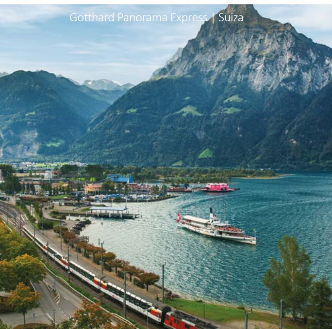
Gotthard Panorama Express | Suiza