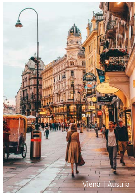
Viena | Austria