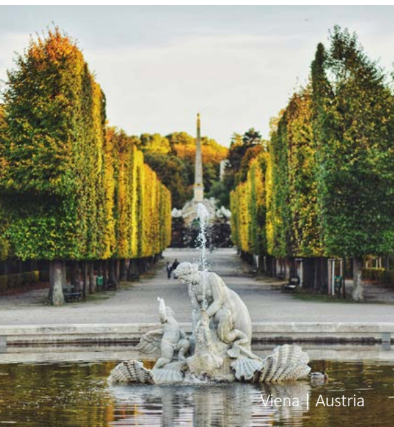
Viena | Austria

Traslado privado al aeropuerto o estación de tren. Fin de nuestros servicios.