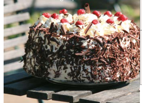
Pastel Selva Negra | Alemania