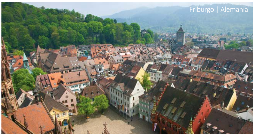
Friburgo | Alemania

Después del desayuno se hará una visita guiada de la ciudad. A continuación, salida hacia Frankfurt con una parada en la ciudad de Würzburg, que forma el límite norte de la "Ruta Romántica". Después de la visita a la ciudad de Würzburg continua el viaje a Frankfurt. El tour finaliza en el Aeropuerto de Frankfurt alrededor de las 17:00 horas. Después parada en el Holiday Inn Alte Oper para los pasajeros con noches extras. Fin de nuestros servicios.