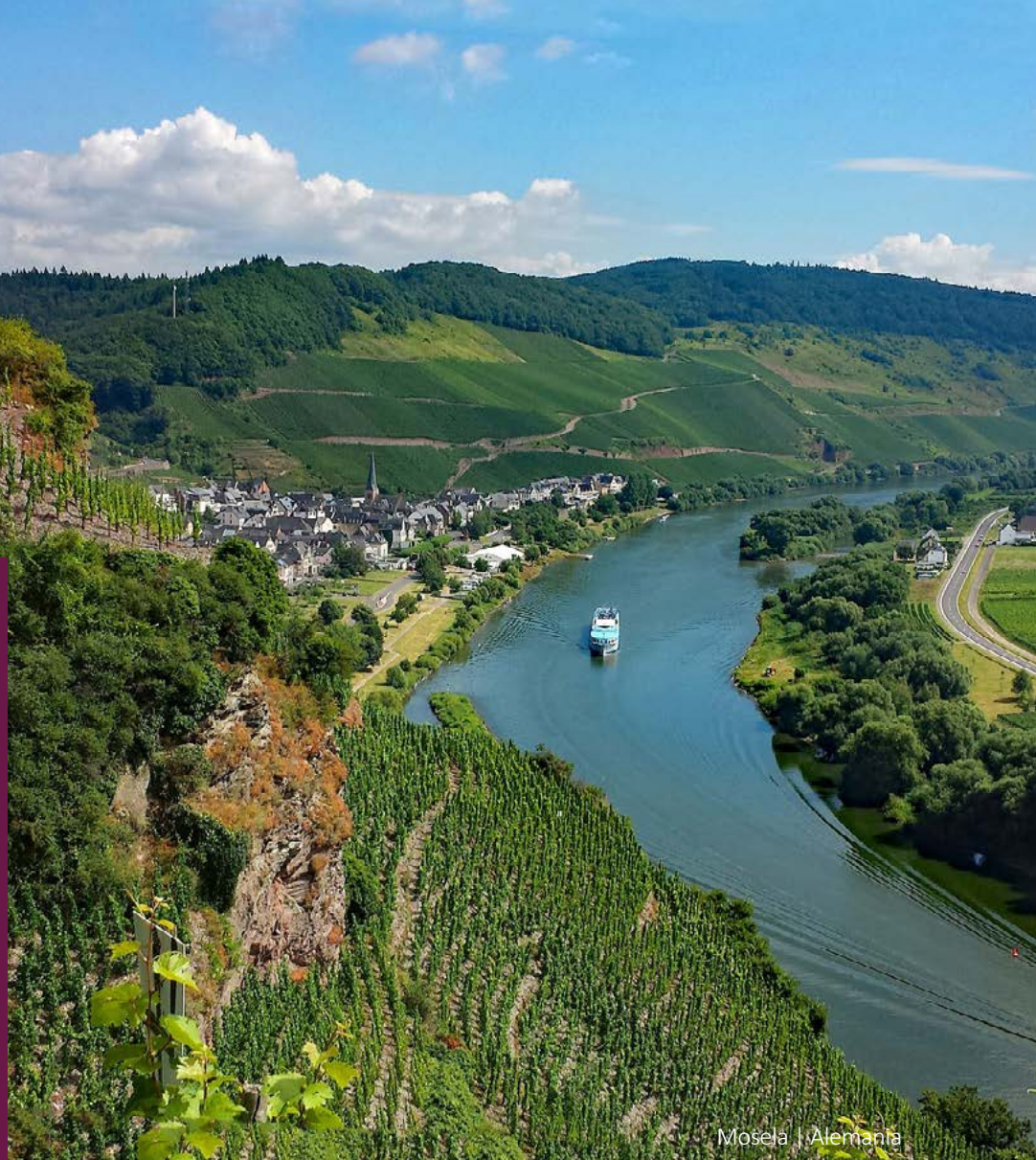
Mosela | Alemania

Obligatorio presentar licencia de conducir nacional e internacional de forma física (no digital). La tarjeta de crédito debe estar a nombre del conductor. No se aceptan tarjetas virtuales ni tarjetas de débito.