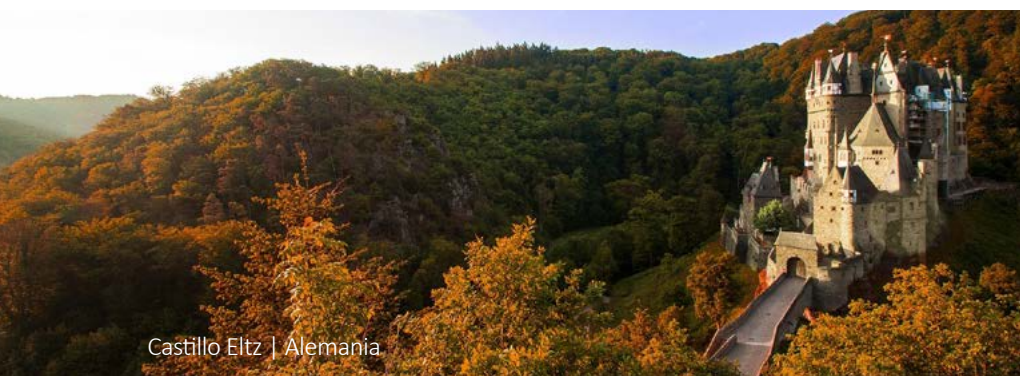
Castillo Eltz | Alemania