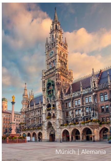
Múnich | Alemania

8 Núremberg - Frankfurt Después del desayuno salida hacia Frankfurt donde termina el tour.