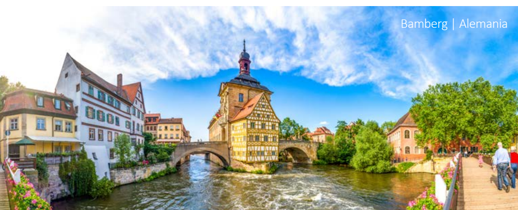
Bamberg | Alemania