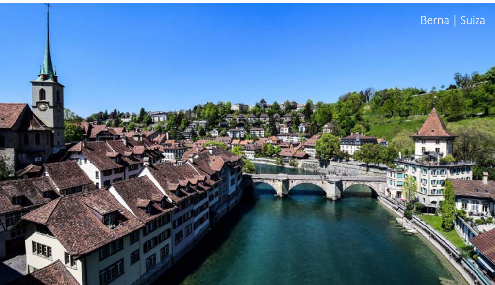
Berna | Suiza