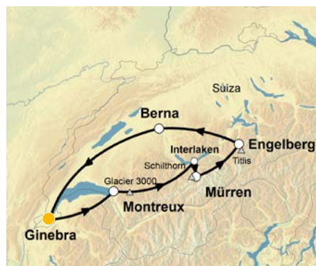
Titlis | Suiza