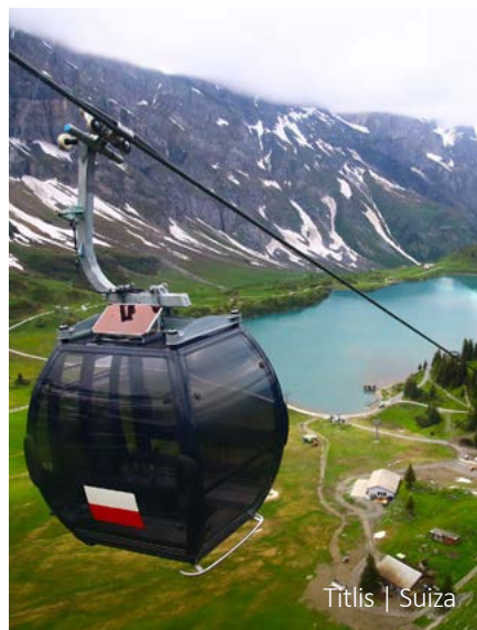
Titlis | Suiza

En su último día de viaje descubrirá los secretos de la capital de Suiza. El casco antiguo de Berna, Patrimonio Mundial de la UNESCO, ha conservado como pocas ciudades su belleza y carácter histórico. Continuación al aeropuerto de Ginebra.