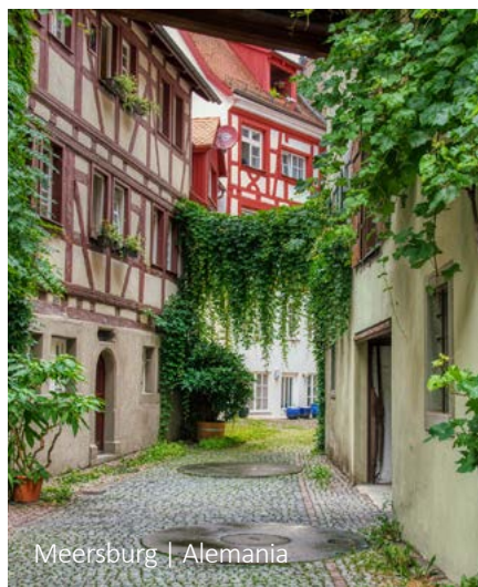
Meersburg | Alemania

Stuttgart no es sólo la sede de Mercedes-Benz y Porsche, es también una de las ciudades más verdes de Europa, con un hermoso centro histórico. Se pueden observar obras maestras de la arquitectura como el Viejo Castillo medieval, el Nuevo Palacio barroco, el hermoso mercado Markthalle y la colonia Weißenhof. El viaje termina en el aeropuerto de Stuttgart.