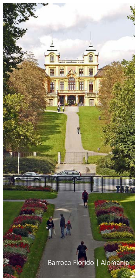
Barroco Florido | Alemania