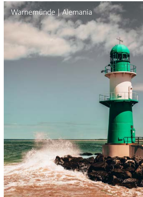
Warnemünde | Alemania