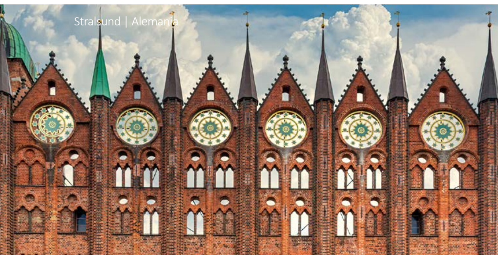
Stralsund | Alemania