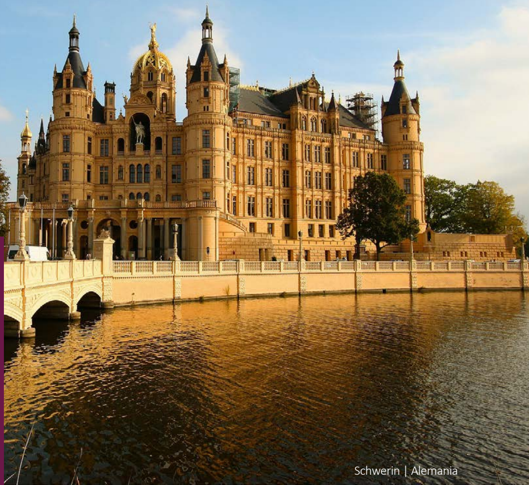
Schwerin | Alemania

Obligatorio presentar licencia de conducir nacional e internacional de forma física (no digital). La tarjeta de crédito debe estar a nombre del conductor. No se aceptan tarjetas virtuales ni tarjetas de débito.