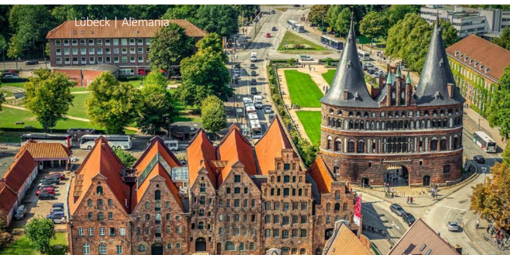
Lübeck | Alemania