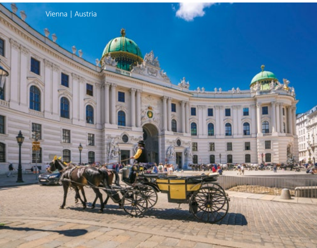
Viena | Austria