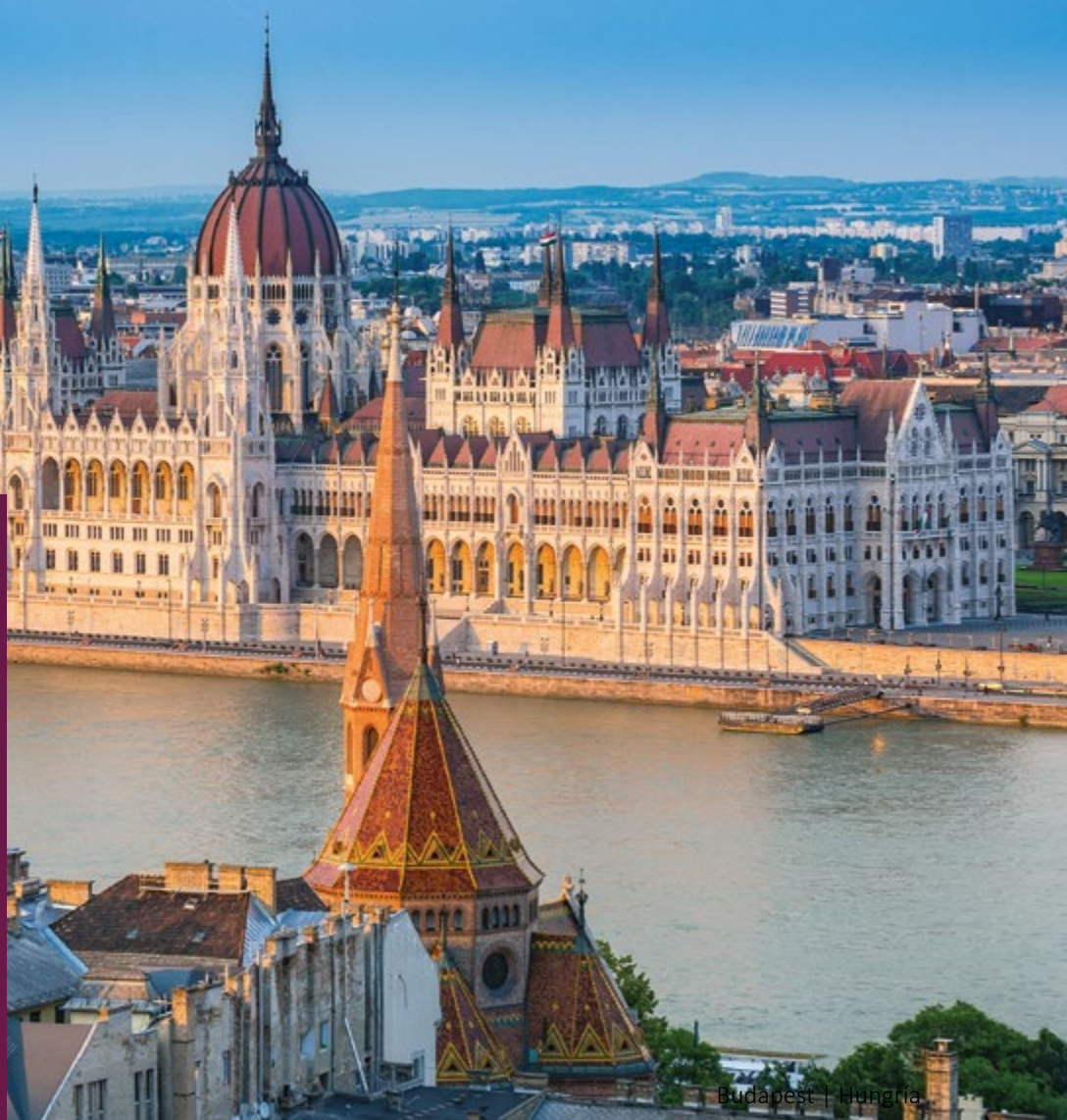
Budapest | Hungría

Obligatorio presentar licencia de conducir nacional e internacional de forma física (no digital). La tarjeta de crédito debe estar a nombre del conductor. No se aceptan tarjetas virtuales ni tarjetas de