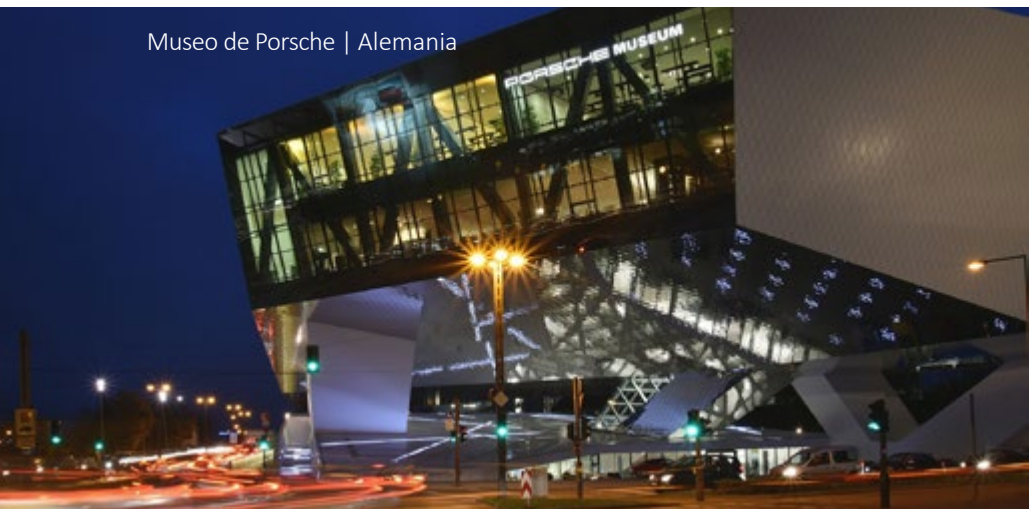
Museo de Porsche | Alemania

7 Múnich - Rothenburg ob der Tauber - Frankfurt Después del desayuno salida hacia Rothenburg ob der Tauber, una de las ciudades más antiguas y hermosas de la Ruta Romántica. Visita panorámica de esta ciudad medieval encantadora. A continuación, viaje a Frankfurt. El programa termina en el aeropuerto de Frankfurt o en el centro de la ciudad.