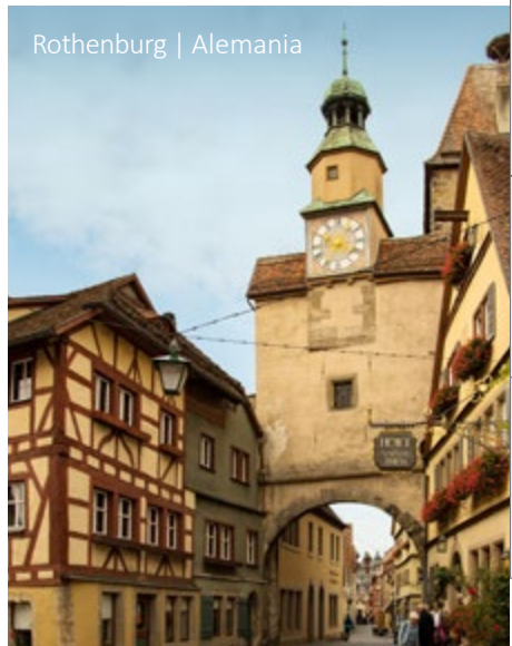
Rothenburg | Alemania