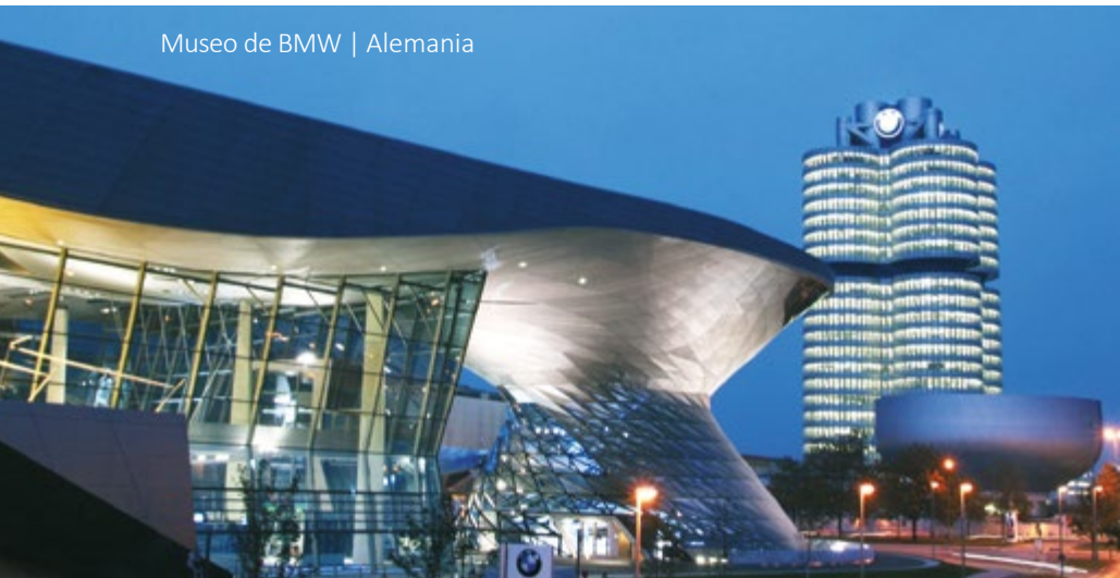
Museo de BMW | Alemania