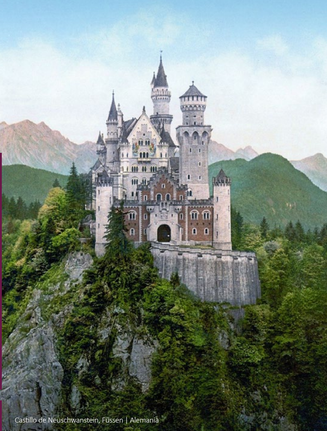
Castillo de Neuschwanstein, Füssen | Alemania

Obligatorio presentar licencia de conducir nacional e internacional de forma física (no digital). La tarjeta de crédito debe estar a nombre del conductor. No se aceptan tarjetas virtuales ni tarjetas de débito.